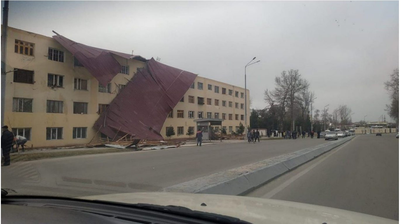
Здание общежития Самаркандского автомобильно-дорожного профессионального колледжа, в котором создали «дом ННО» 12 февраля 2020 г.

Конечно, несколько «домов ННО» не решат проблему всех действующих ННО, особенно самоинициативных и не имеющих доступа к господдержке, – всем может просто не хватить места. Кроме того, остаются неясными критерии, по которым будут выделяться помещения в таких «домах» . Есть опасения, что в них разместят скорее всего системообразующие ННО, или ГОНГО, а самоинициативные так и останутся без офисных помещений. В майском указе президента упоминалось, что помещения в «домах ННО» будут выделяться в первую очередь вновь создаваемым ННО и осуществляющим свою деятельность в социальных значимых сферах с применением «нулевой» ставки арендной платы. Есть опасения, что данные критерии не будут соблюдены и места в создаваемых «домах ННО» в первую очередь предоставят ННО, образованным с помощью государства, а не самоинициативным ННО.