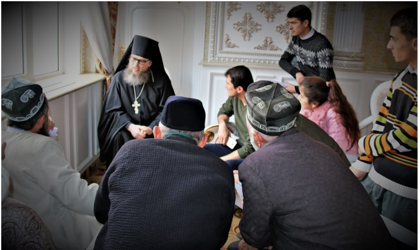
Намоёндагони динҳои гуногун дар Душанбе дар фестивали байнидинии "Тоҷикистон хонаи мо" , ки аз сӯи намоёндагии Институти инъикоси ҷанг ва сулҳ дар мушорикат бо Кумитаи дин, танзими анъана ва ҷашну маросими назди Хукумати Ҷумҳурии Тоҷикистон доир карда шуд.

сабаби низоъҳо дар сатҳи равобити иқтисодӣ ва қудратӣ, мубориза миёни гуруҳҳои манфиатҳои мухталиф барои манобеъ ва нуфӯз нухуфтааст. Дар давраи бухрон асоси баръалои низоъ аксаран омилҳои мебошанд, ки дар сатҳи мавқеъ доранд, аммо бо вучуди ин сабаби асосӣ намебошанд. Ҳамчун нуқтаи заъф ҳар чизе метавонад хизмат намояд: шаъну эътибори поймолшуда, озорҳои таърихӣ, талоши барқарор кардани адолат, ҷустуҷӯи гунаҳгорон, даъвати раҳбари харизмотик ва ҳатто низоъи муқаррарии маишӣ.