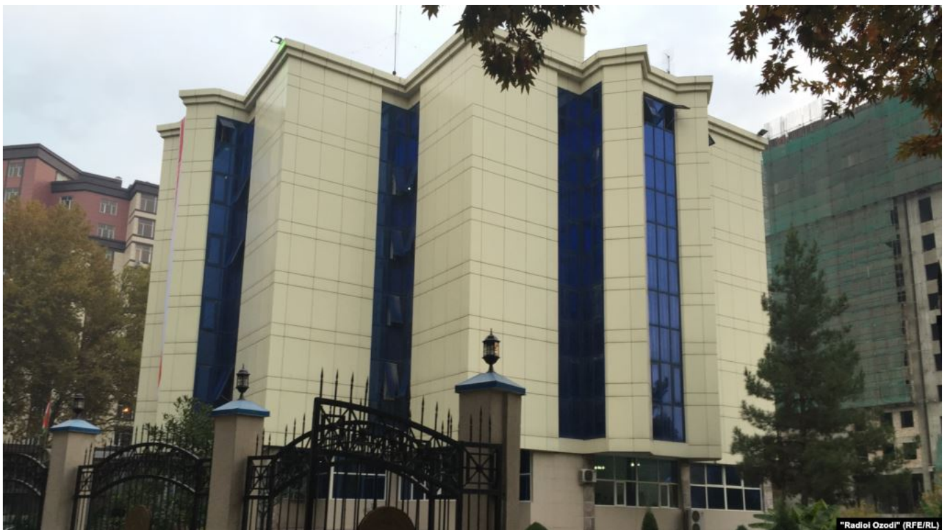
Хадамоти гумруки Тоҷикистон.

Парлумони Тоҷикистон пас аз интиқоди раисҷумҳур дар охири моҳи май Протоколи иловагӣ ба Конвенсия дар бораи аҳднома оид ба боркашонии байналмилалӣ нақлиёти марбут ба борхати электрониро тасдиқ намуд.