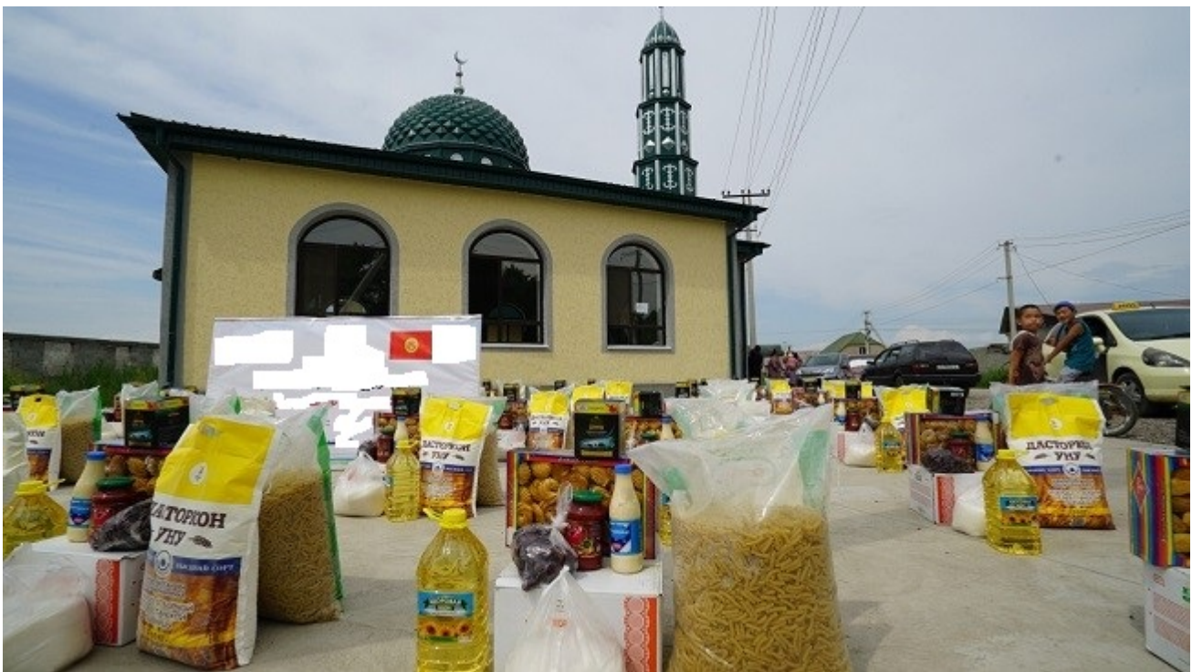
Иллюстративная фотография.

Весьма странно, что они не ведут эту деятельность, зарегистрировавшись в качестве религиозной организации, отмечают эксперты. Хотя в этом может быть своя логика: религиозную организацию зарегистрировать сложнее, за ней государственный контроль более тщательный, чем за деятельностью фондов или благотворительных организаций.