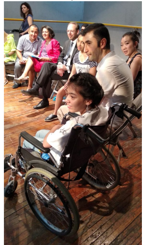
Инклюзивная площадка в театре "Ильхом" в Ташкенте.

Всем очевидно, что надо создавать безбарьерную городскую среду для людей с ограниченными возможностями. Законы есть. В чем проблема?