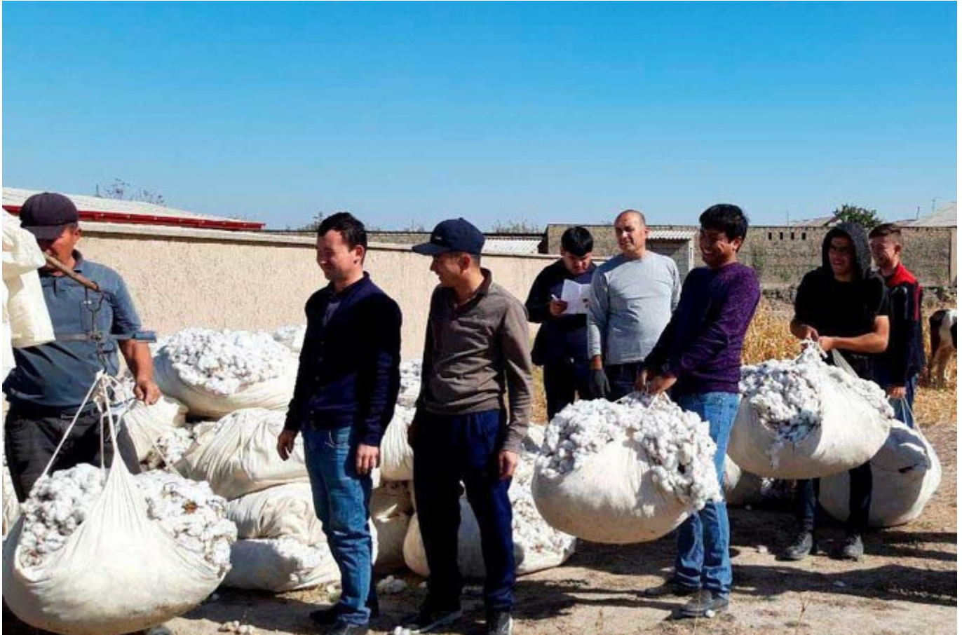
Судьи и сотрудники областных, районных и городских административных судов вышли на сбор хлопка в Пастдаргомском районе Самаркандской области 20 октября 2019 года.

Однако создается впечатление, что правительство в данном вопросе играет в двойную игру.