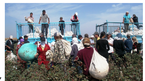
Читайте также: Избавился ли Узбекистан от принудительного труда на хлопке?

В то же время правительство поставило перед собой амбициозную задачу – перестать [10] уже в 2020 году экспортировать хлопок-сырец, перерабатывая его весь на месте с целью экспорта продукции с добавленной стоимостью – пряжи, тканей и даже одежды. Мешает этому плану среди прочего бойкот [11] узбекского хлопка, объявленный более 300 компаниями мира. Этот бойкот распространяется и на хлопковый текстиль. А для того, чтобы снять этот барьер, правительство должно убедить