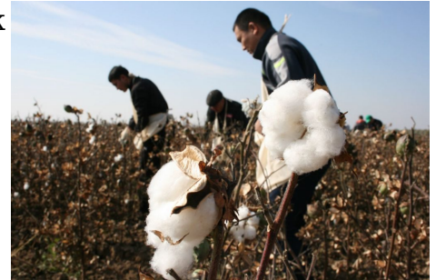
Читайте также: С бойкотом узбекского хлопка не покончено

С другой – централизованно спущенные и обязательные к исполнению квоты по сдаче хлопка никто пока не отменял. Такие ведомства, как минфин, министерство сельского хозяйства, а также хокимы на местах до сих пор отвечают за выполнение этих квот. Наиболее видимыми на публике фигурами, дающими указания по мобилизации населения на сбор хлопка, являются хокимы. И у них по сути нет другого выхода, как прибегать к старой практике принудительной мобилизации и всякого рода ухищрениям, чтобы скрыть факт принуждения (например, заставлять [9] сборщиков подписывать заявления о том, что собирают хлопок добровольно). Ведь при существующих ножницах цен (все еще низкие спущенные сверху цены за хлопок, не покрывающие себестоимость производства) привлечь рабочую силу на сбор урожая одними экономическими стимулами не представляется возможным.