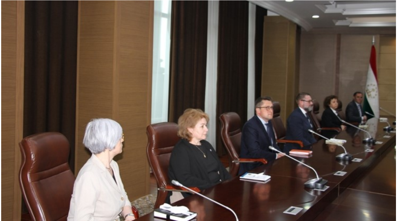
Делегация ВОЗ на встрече у премьер-министра Таджикистана Кохира Расулзода.

Всемирная организация здравоохранения является отделением Организации Объединенных Наций и начала свою работу в 1948 году. По словам экспертов, основная миссия организации заключается в помощи странам создавать эффективную систему здравоохранения, чтобы они могли защитить здоровье своих жителей. Однако некоторые эксперты подвергают работу Всемирной организации здравоохранения в Таджикистане критике, указывая, что она не справляется со своей задачей.