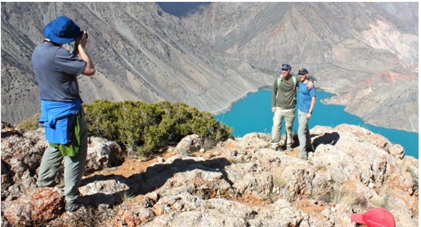
Количество туристов в Таджикистан сократилось.