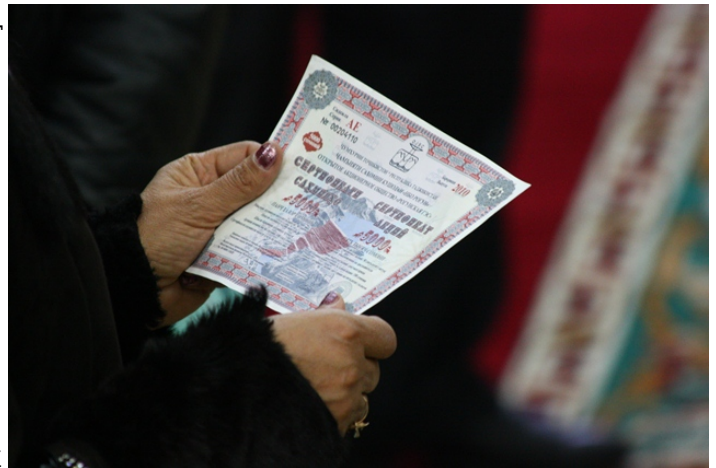
В начале 2010 года власти распространяли акции Рогунской ГЭС.

По словам экспертов, сбор средств за счёт народа напоминает сбор средств на строительство Рогунской ГЭС. В начале 2010 года правительство Таджикистана призвало всех жителей страны купить акции Рогунской ГЭС. В то время правительство уверяло общественность, что электростанция может быть построена на народные деньги. В СМИ сообщалось, что нередко применялось давление на граждан, чтобы принудить их приобрести акции Рогунской ГЭС. Например, водителей на контрольно-пропускных пунктах просили предоставить акции вместо автомобильных документов. В университетах студентам не разрешалось сдавать экзамены без наличия акций.