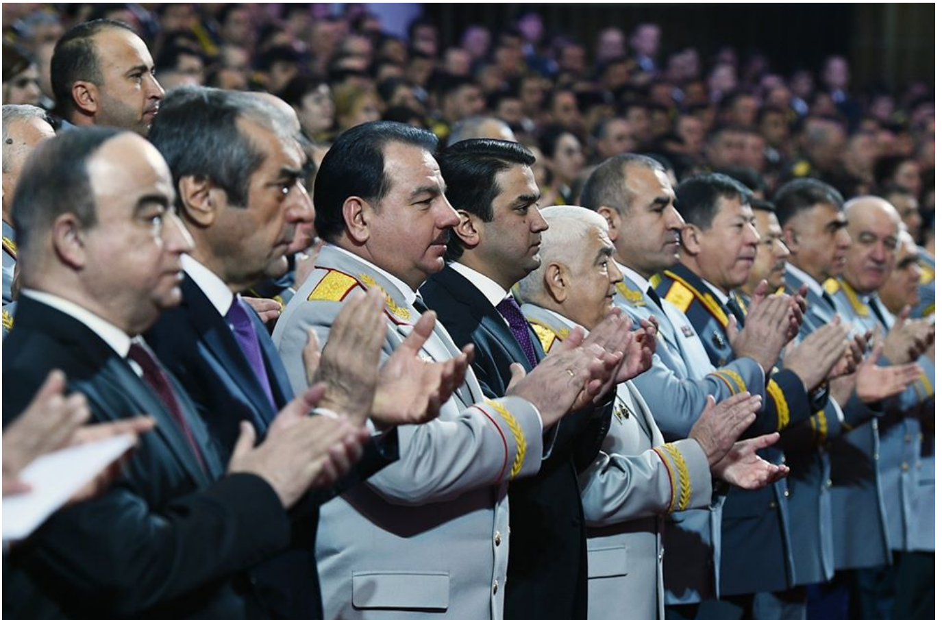
Таджикские руководители по примеру президента Эмомали Рахмонова передают часть зарплаты в фонд борьбы с COVID-19. Иллюстративная фотография.

1 апреля этого года в Таджикистане открыли специальный банковский счет для сбора благотворительных средств для борьбы с распространением COVID-19.