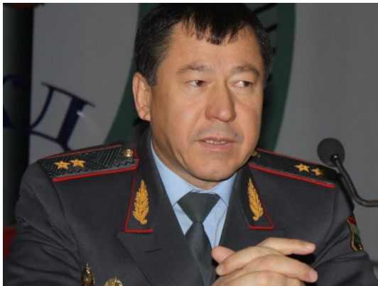
Глава МВД Таджикистана Рамазон Рахимзод.

Госинформагентство «Ховар» сообщает, что среди них спикер нижней палаты парламента, его заместители и депутаты, руководство министерства промышленности и новых технологий, комитета по делам молодежи и спорта, председатель Хатлонской области, работники Антимонопольной службы, Академии управления, Государственного академического театра оперы и балета.