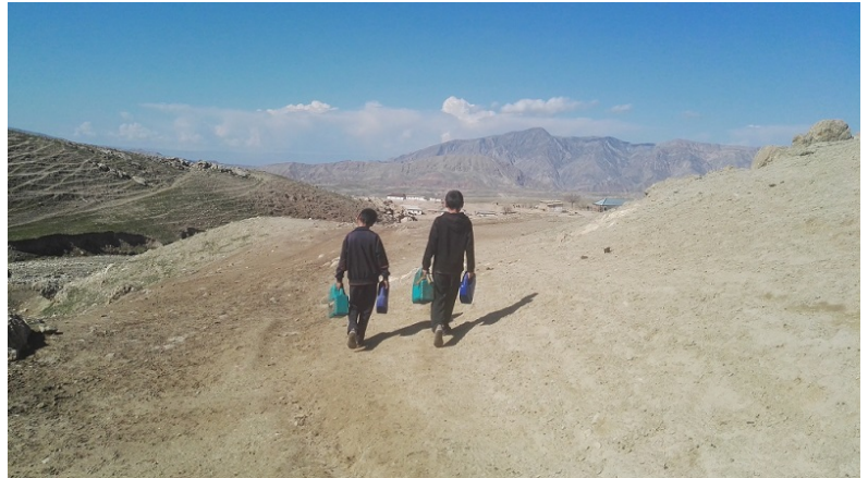
Дети села Лолазор несут канистры с водой домой.

Проблемы доступа к питьевой воде изрядно усложняют жизнь жителей ряда районов Хатлонской области на юге Таджикистана. Их многочисленные жалобы пока никем не услышаны.