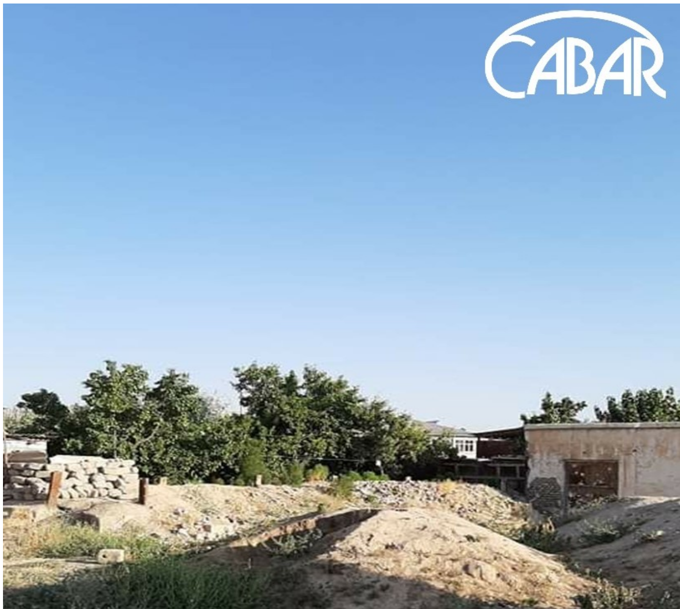
Клуб, расположенный в махалле Джаматак, теперь это частный дом.