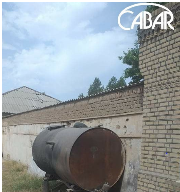
А это бывший клуб махаллы "Карлик" Олтинсайского района Сурхандарьинской области. Сейчас это государственный заповедник.