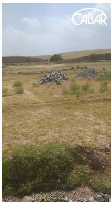
Место бывшего клуба махалли Обшир Олтинсойского района Сурхандарьинской области.

Наверно, теперь только старшее поколение жителей Центральной Азии помнят, что такое сельские клубы. Для молодежи слово «клуб» ассоциируется совсем с другими понятиями, типа - лужайки для гольфа, теннисные корты, клубы для богатых людей и т.д.