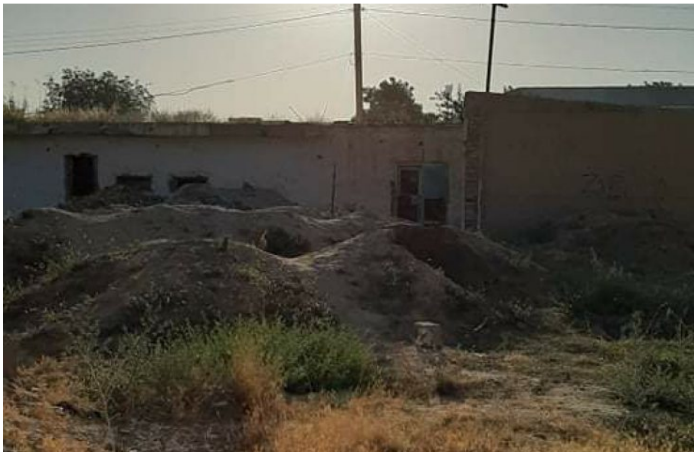
Заброшенный клуб села "Фарид Ираев" ул. Кумкурганского района Сурхандарьинской области.