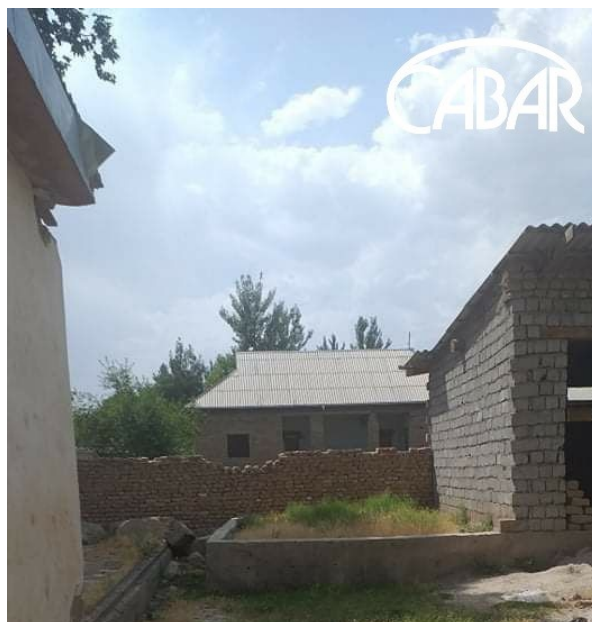
Сегодня на месте бывшего посёлкового клуба "Джоби" махалли Олтинсойского района Сурхандарьинской области население строят свои дома.

Жители Ферганской и Сурхандарьинской областей жалуются, на то, что, к сожалению, такими местами стали пренебрегать в последние годы. Большинство из них пришло в запустение. Клубы и дома культуры во многих селах были приватизированы, превращены в свадебные залы, кафе или рестораны. Некоторые из них находятся в таком плачевном состоянии, что люди боятся