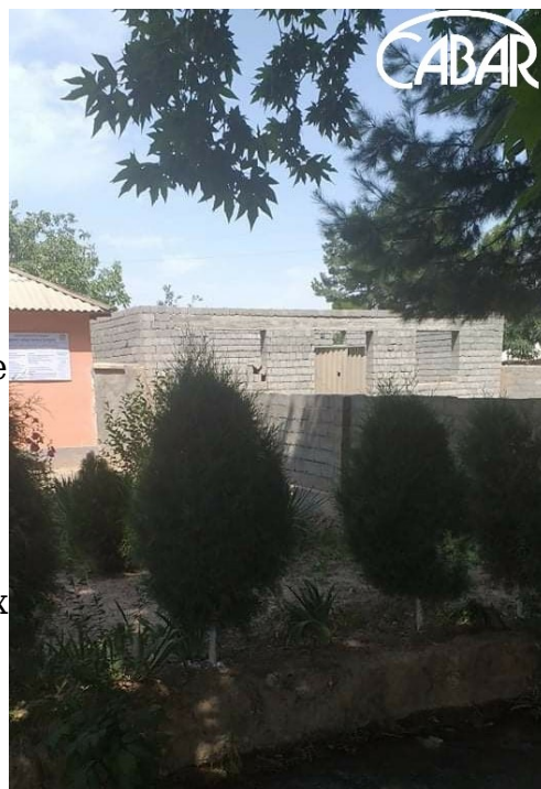
На этом месте когда-то был сельский клуб махаллы "Мармин" Олтинсойского района Сурхандарьинской области. Сейчас он выкуплен предпринимателем, который строит здесь магазин.

Сейчас в этой махалле - более 3,5 тысяч домохозяйств. Большинство из 18 тысяч жителей, это молодежь. Такие культурные центры очень нужны для духовных и образовательных целей, для того, чтобы направлять молодых людей, защищать их от вредных влияний различных чужеродных идей, для того, чтобы улучшать духовную атмосферу в семьях, а также