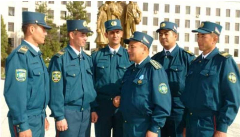
Ўзбекистон милитсияси ходимлари.

Хатто СОВИД-19 карантин даврида ҳам тақиқланган ғоялар тарқалишда давом этмоқда ва Ўзбекистон мусулмон жамоасининг илмлари кам қатламларини онгига захарлаши давом этмоқда. Шундай ҳолатлардан бирида, 32 яшар Навоий вилоятида яшовчи бир йигит, уйда қолишга оид карантин қоидаларига риоя қилган ҳолда, Интернетда радикал экстремистик ташкилотлар (РЕТ) ғоялари билан “захарланган”. Ўзбекистон Ички ишлар вазирлиги 7 апрел куни хабар беришича , йигит Odnoklassniki.ru сайтида уйдирма ном билан профил очган ва шу akkaунт орқали турли тақиқланган Интернет манбаларига кириш имкониятига эга бўлган. Йигит Ўзбекистонда тақиқланган ХТТнинг руҳий лидерининг ваъзларини юклав олгандан сўнг, уларни “виртуал” дўстлари орасида тарқатишни бошлаган.