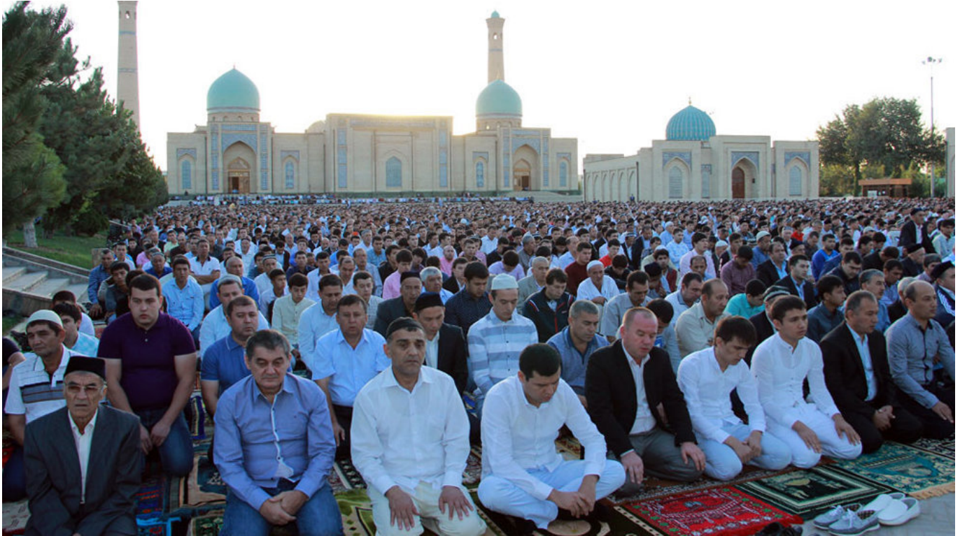
Намоз пайтида ўзбекистонликлар.

Мамлакатда радикаллашув ва ҳатто дерадикаллашувга қарши курашишга қаратилган бир қатор пилот лойиҳалар амалга оширилмоқда. Ушбу лойиҳалардан бири Тошкентнинг Олмазор туманида амалга оширилди. Ушбу соҳада маҳаллий ички ишлар марказида тажрибали диншунослар, ислом уламолари ва имомлар ишлайдиган маслаҳат маркази ташкил этилган. Тошкентнинг ҳар қандай фуқароси ушбу марказга мутлақо аноним равишда мурожаат қилиши ва мутахассисларга Қуръон ва Ислом аҳкомларини шарҳлаш билан боғлиқ саволлар беришлари мумкин. Ота-оналар ёшларнинг диний ақидаларда адашиб, нотўғри қарорлар қабул қилишга тайёр бўлган турли хил ҳаётий вазиятларда болаларнинг хатти-ҳаракатлари ҳақида сўрашди. Маслаҳат олиш учун Интернетда кўплаб “жиҳодчи” ғояларни эшитиб олган дўстларини олиб келган одамлар ҳам бор эди. Яхши ижобий таъсир кўрсатадиган жуда қизиқарли ва муҳим тажриба бўлди десак муболаға бўлмайди.