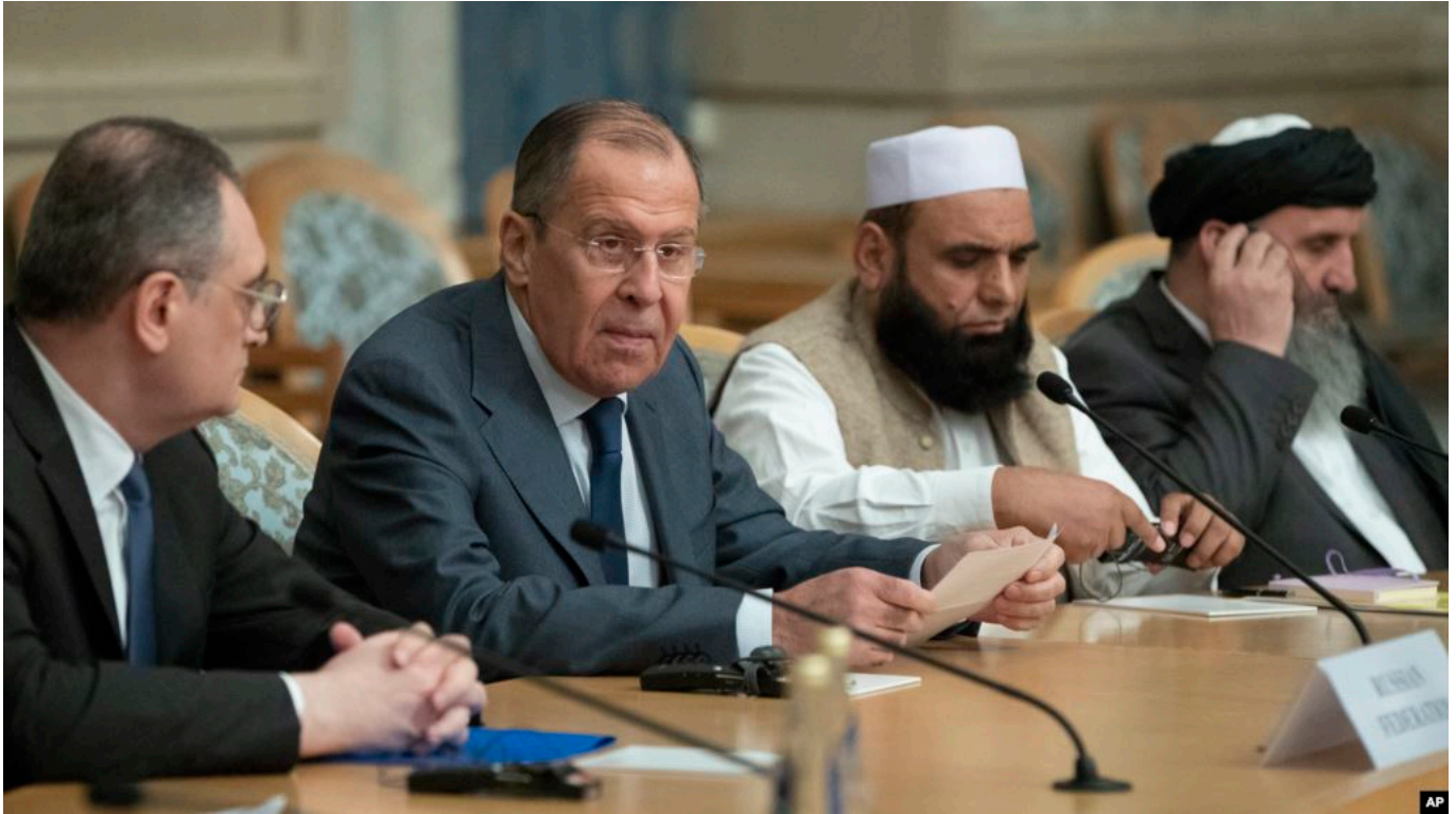
Музокирот бо Толибон дар Маскав: Акс аз Reuters

Толибон дар фаъолияти худ то ҳоло кадом кори шоистаеро ба анҷом нарасонидаанд. Ин барои ҳамагон маълум аст, аммо ҷомеаи ҷаҳонӣ ба раҳбарии Амрико маҷбур аст, ки иқдоми сулҳро пеш гирад. Чаро Русия ҳамчунин пешниҳодро матраҳ кардааст? Русия барои ҷилавгирӣ аз хатари ДОИШ дар Афғонистон ва пеш аз ҳама кишварҳои Осиёи марказӣ ин иқдомро пеш гирифт.