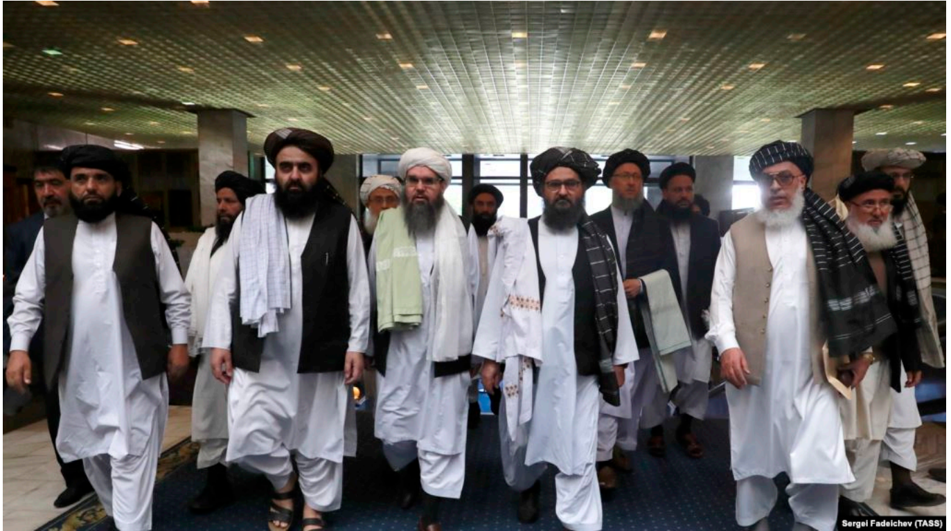
Ҳайати Толибон дар Маскав.

Албатта, то андозае ин андеша ва тахмину гумонҳо дуруст аст. На танҳо ба афкори созмонҳои тундрав барои мардуми кишварҳои минтақа ҳам таъсир расониданашон мумкин аст. Лекин ман боз такрор мекунам, ки мо ҳоло гуфта наметавонем, ки Толибон сад дар сад ба сари қудрат меоянд ва дар Афғонистон худи мардум ақидаҳои онҳоро пурра қабул доранд ва онҳо дар сари қудрат мемонанд. Такрор ҳам шавад агар даҳлат ва ҳамкориҳои онҳо бо чунин неруҳо сурат гирад, ман фикр намекунам, ки ҷомеаи ҷаҳонӣ дар ин масъала ором шинад ва даст ба иқдом назанад, ё ки бетарафӣ зоҳир наояд.