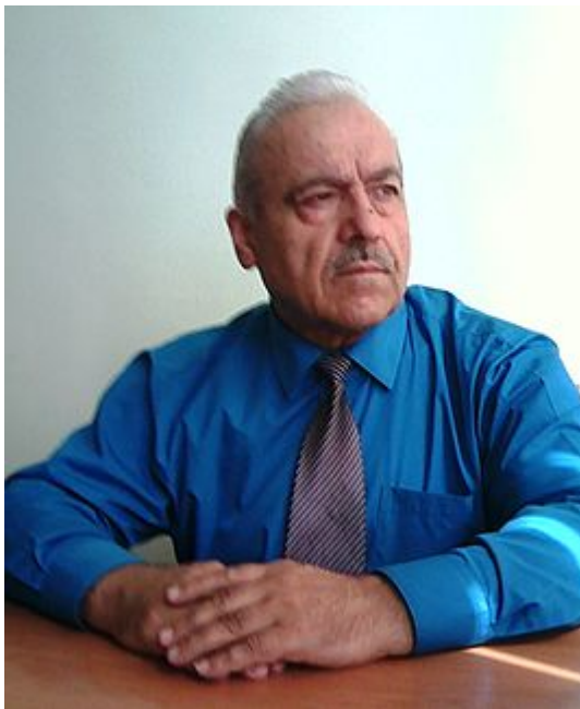
Исмоил Раҳматов.

CABAR.asia: Амрико ва Русия ду кишвари абарқудрати олам талош доранд, ки Толибонро ба арсаи сиёсӣ оварда, дар идораи ҳокимият дар Афғонистон шарик бисозанд. Бад-ин манзур чандин навбат музокирот ҳам дар кишварҳои мухталиф, аз ҷумла дар Русия, бо ширкати Толибон, намояндагони ҳукумати Афғонистон ва аҳзобу шахсиятҳои муътабари ин кишвар баргузор шуд. Чаро Русия ва Амрико ба чунин иқдом даст заданд?