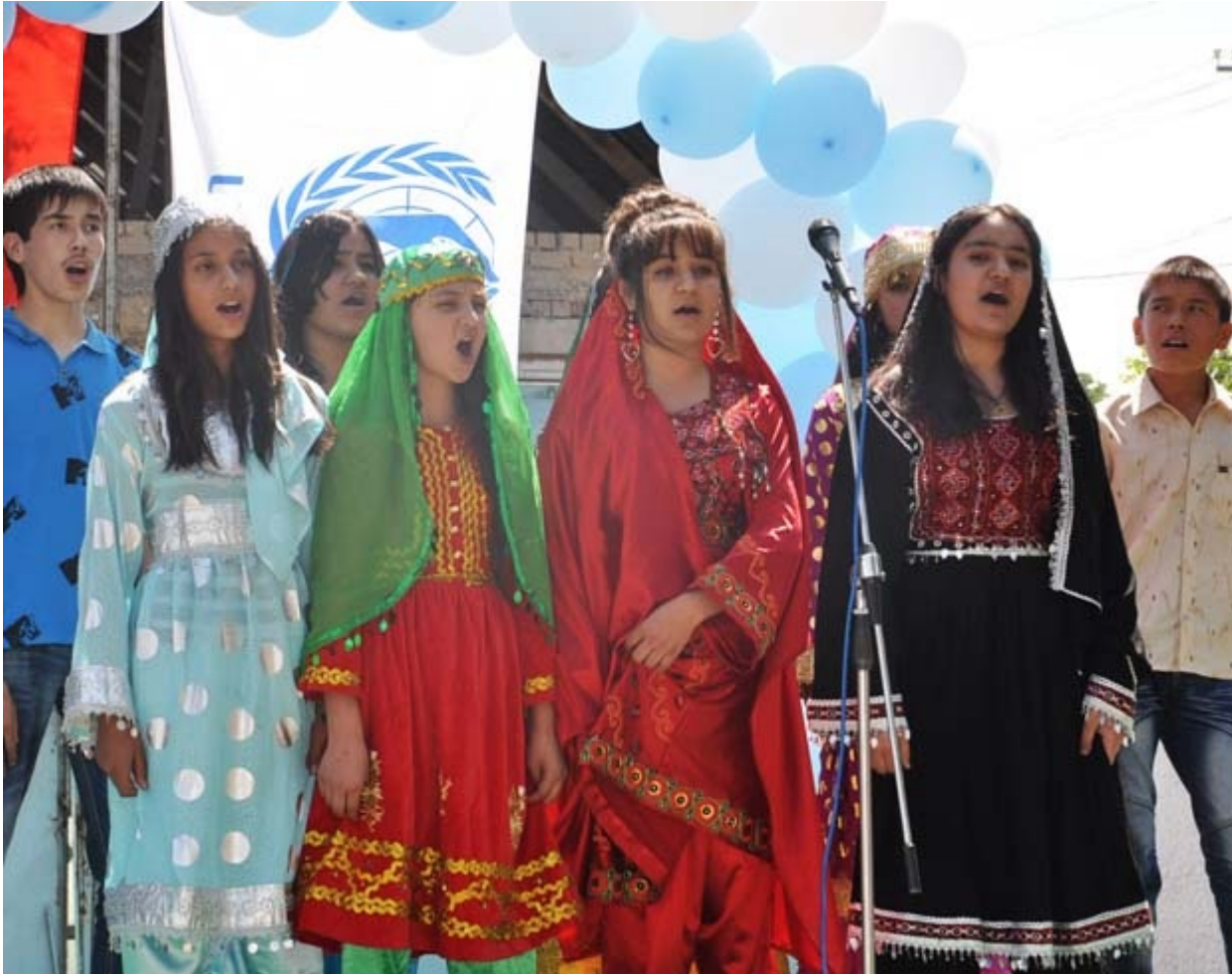
Беженцы в Кыргызстане на презентации национальный культур.

Как сообщили в отделе по работе с беженцами при Госслужбе миграции, кыргызское правительство только за этот год признало 9 лиц беженцами и выдало им соответствующее свидетельство. Получить статус беженца не просто, нужно пройти ряд процедур.