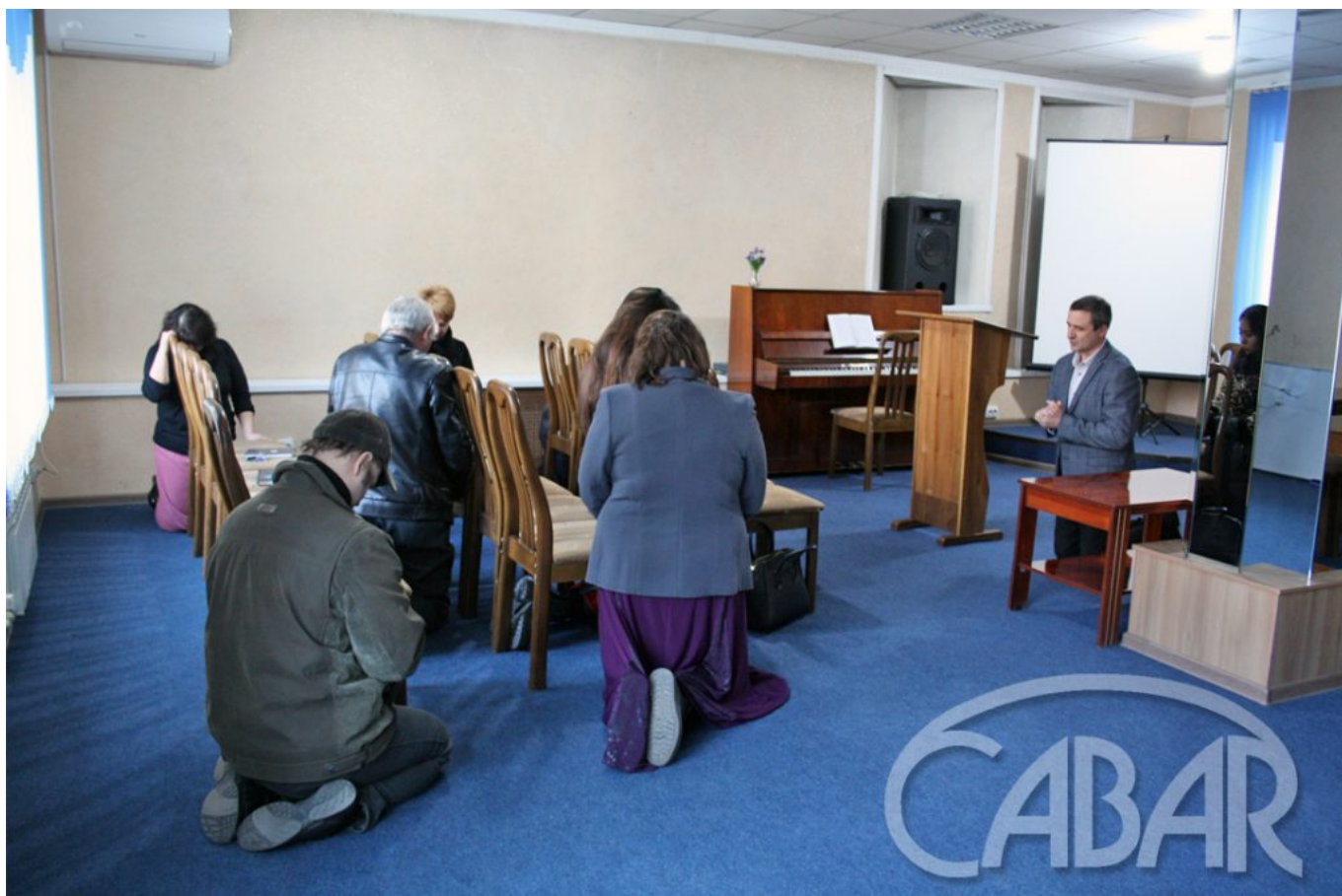
Чиркөөнүн өзүндө иштеген дин кызматкерлери күн сайын сыйынып турушат