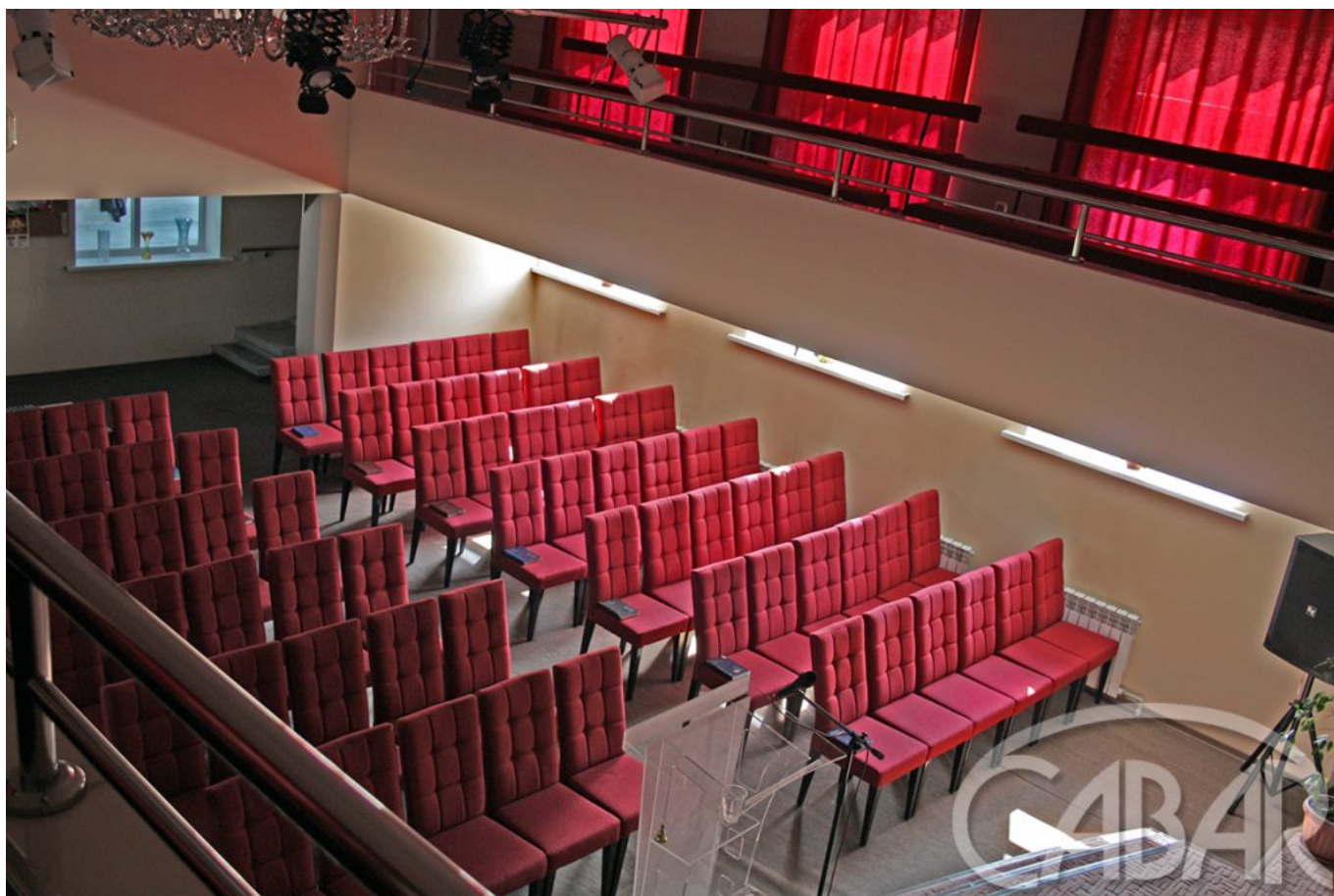
Ишемби күнкү кызматтар өтө турган эсai