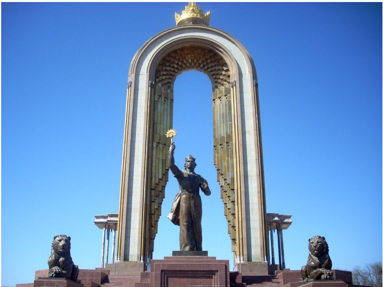
Памятник Исмаилу Самани, эмиру из династии Саманидов, в Душанбе.

территории, языка, культуры, исторической судьбы, этнического самосознания , государственной принадлежности, религии и т.д.» [2] . Таджикистанские историки в противовес узбекистанским коллегам создали собственную версию, где утверждается, что «таджики еще в период своего первого государственного образования – Государства Саманидов – сложились в единый народ на основе общности территории и единого, почти современного, языка, с небольшими диалектическими отличиями. Естественно, в те далекие времена еще не могли появиться другие элементы, способствующие образованию полноценной нации» [3] .