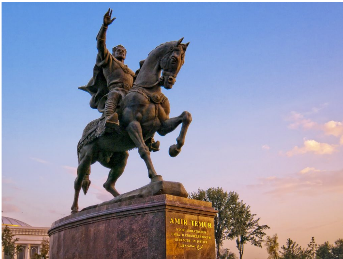
Памятник Амиру Темуру (Эмир Тимур, Тамерлан Великий, Темур Великий, Хромой Тимур) в Ташкенте.

В Узбекистане национальным героем и символом национальной государственности стала фигура Амира Тимура, а в Таджикистане – Исмаил Самани, т.е. два государственных деятеля стали олицетворять стремления молодых государств. В честь Тимура был построен музей в центре Ташкента, а в крупных городах республики появились его памятники. Образ Тимура также трактовался как освободитель народов Средней Азии от монголов, что наталкивало мысль на Ислама Каримова, под руководством которого Узбекистан обрел независимость.