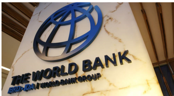
Всемирный банк снизил прогнозы роста экономики Узбекистана.

В авангарде экономики находится сфера строительства, где трудится около 1,3 млн человек. Еще одним ведущим сектором экономики является текстильная промышленность - эти два сектора получают беспрецедентные льготы и меры финансовой поддержки.