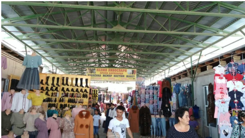
Власти возобновляют работу бизнеса, чтобы возместить потери бюджета.