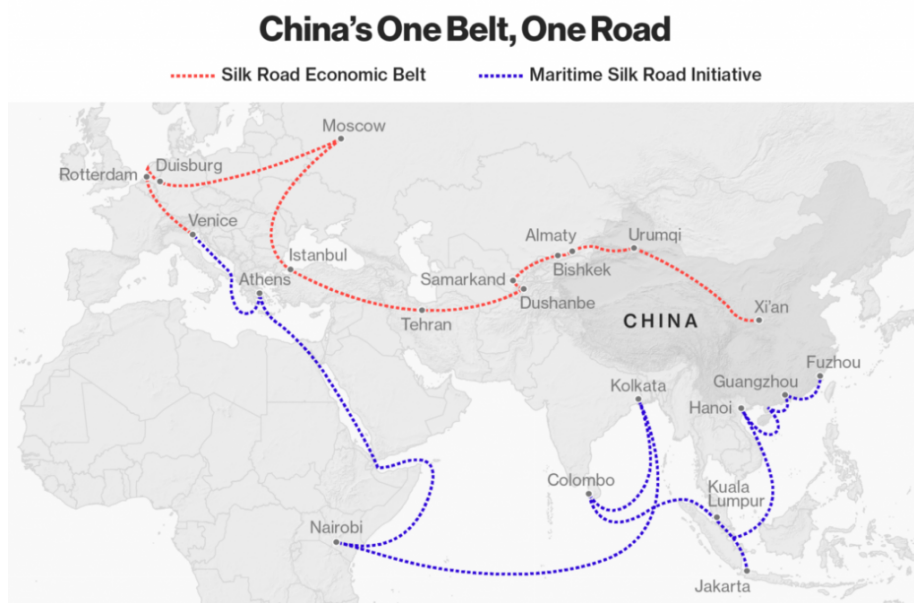
Сопряжение «Нурлы Жол» и инициативы «Пояс и Путь».

Казахстан был первой страной, проявившей сильный интерес к китайской инициативе, включив свою пятилетнюю (2015-2019 гг.) Государственную программу развития инфраструктуры «Нурлы жол» в инициативе «Пояс и Путь»[10]. Хотя Китай полагается на казахстанский импорт энергоносителей и считает своего ближайшего западного соседа важным звеном в реализации инициативы «Пояса и пути», экономика Казахстана в