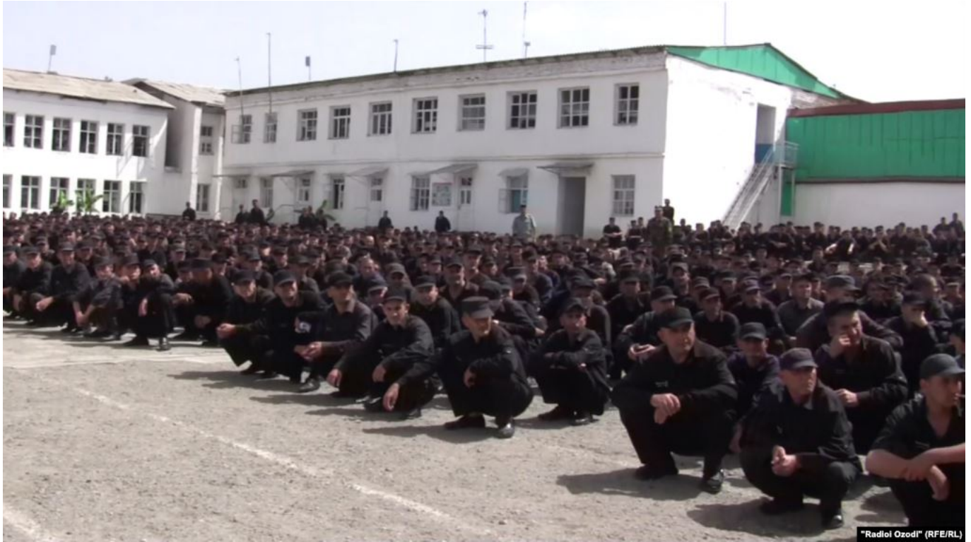
Власти Таджикистана не допускают правозащитников в тюрьмы.

Родственники заключенных сказали, что единственная «привилегия», которую предоставило правительство во время пандемии – ежедневные разговоры с родственниками, которые сидят в тюрьмах. Однако некоторые задержанные намекнули, что не обо всём можно говорить, потому что телефоны могут прослушиваться, и это создаёт трудности.