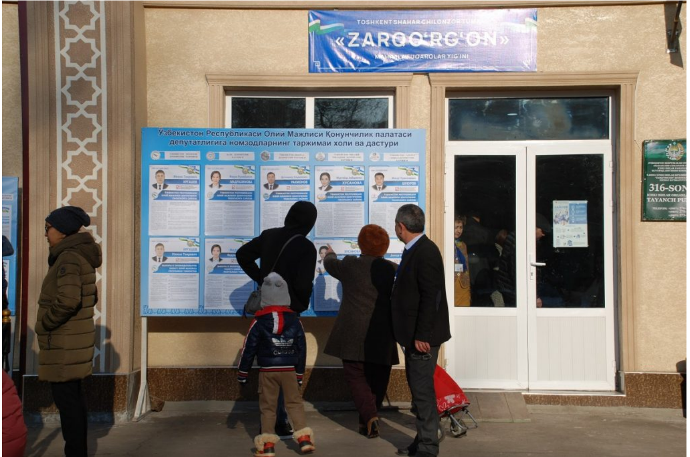
В день выборов в Ташкенте.

«Позвонили и вежливо спросили, почему я не пришел на выборы. Я ответил, что это моя гражданская позиция. После этих слов попрощались, еще раз спросив, мое ли это решение», – рассказывает житель Ташкента Рустам .