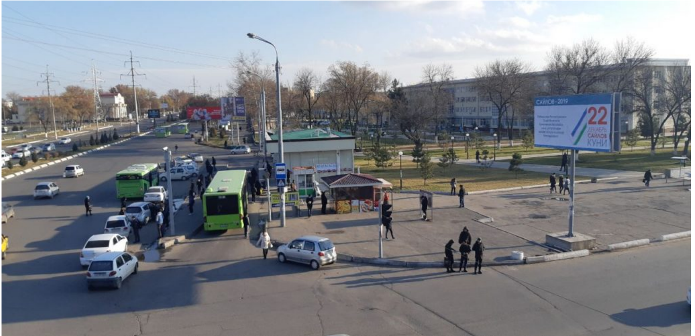
По мнению ОБСЕ, предвыборная активность слабо наблюдалась на улицах.

Между тем, миссия наблюдателей Бюро по демократическим институтам и правам человека (БДИПЧ) ОБСЕ заявила, что многие характерные черты прошлых выборов наблюдаются и в ходе нынешних. Об этом говорится в промежуточном докладе БДИПЧ ОБСЕ, опубликованном 13 декабря.