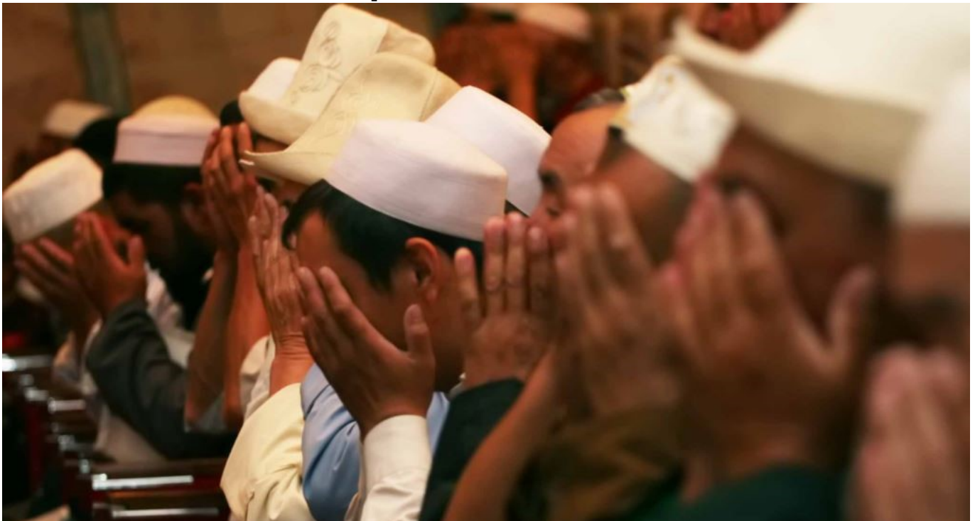
На сегодняшний день именно «дааватчики» являются главным барьером, останавливающим распространение идей и практик салафизма в Кыргызстане.

Однако депутат ЖК КР Исхак Масалиев в отношении Таблиги Джамаат поднимает вопрос о несоблюдении единых принципов Конвенции ШОС по противодействию экстремизму со стороны Кыргызстана. По его мнению, в соответствии с конвенцией ШОС Кыргызстан должен признать Таблиги Джамаат незаконной. В конвенции ШОС утверждается, что все члены-государства преследуют единые принципы. Следовательно, в некоторых странах, которые присоединились к этой конвенции, Таблиги Джамаат была признана вне закона. Соответственно и наша республика должна сделать ее вне закона и признать незаконной [10] .