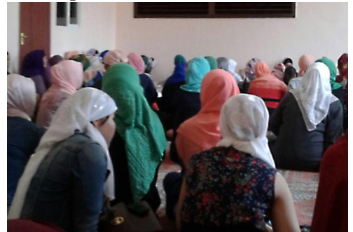
Материал по теме: Чем занимается женское крыло Таблиги Джамаат в Кыргызстане?

Возможно вопрос о Таблиги Джамаат не стоял бы так остро, если бы Кыргызстан на сегодняшний день не являлся единственной страной в Центральной Азии, где это движение ещё не считается экстремистским и запрещенным. Существует рекомендация Организации договора о коллективной безопасности (ОДКБ) о запрете Таблиги Джамаат, принятая и Россией и другими государствами Центральной Азии, кроме Кыргызстана. До сих пор министерство внутренних дел Кыргызской Республики и Государственная комиссия по делам религий стояли на позиции, что у них нет оснований считать Таблиги Джамаат экстремистской организацией.