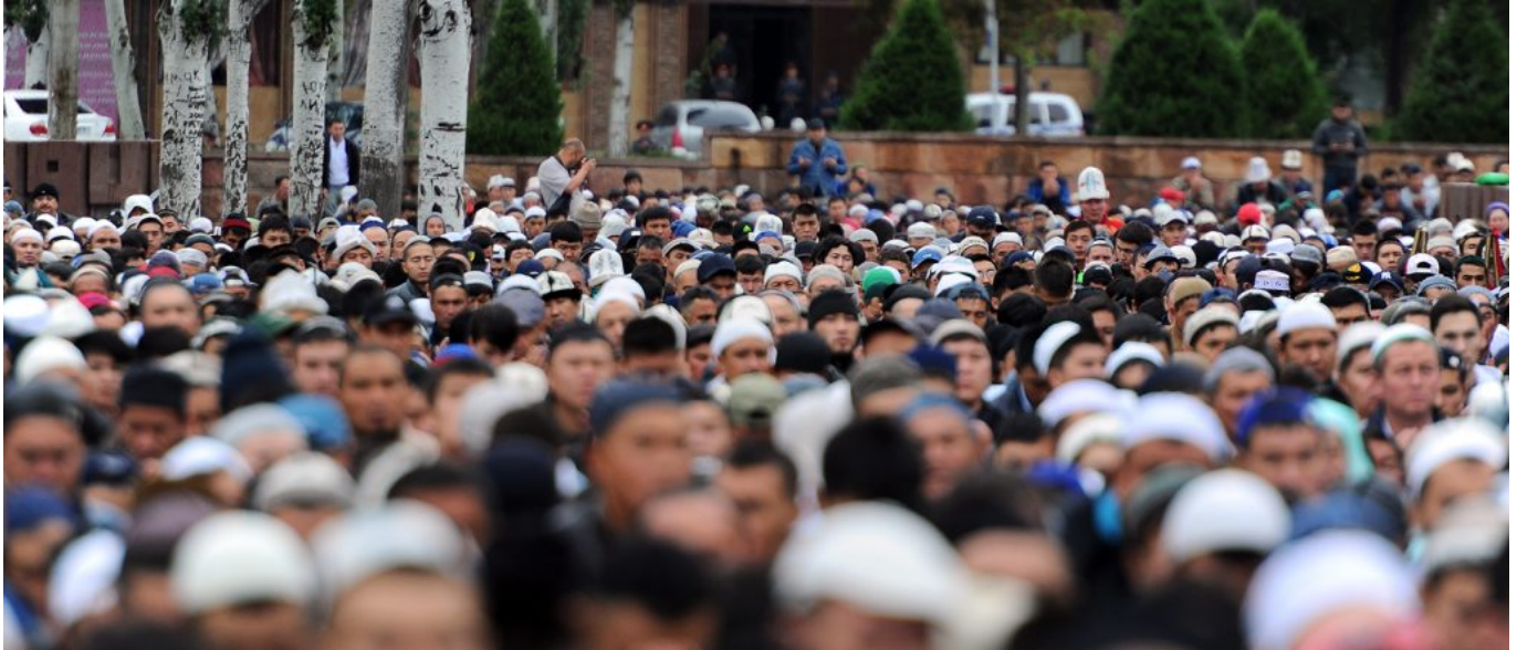
Кыргызстан на сегодняшний день единственная страна в Центральной Азии, где движение не считается экстремистским.

проявляются в попытках вмешательства некоторых религиозных деятелей и организаций в политический процесс. В связи с этим вопрос аполитичности движения Таблиги Джамаат занимает центральное место в изучении его деятельности.