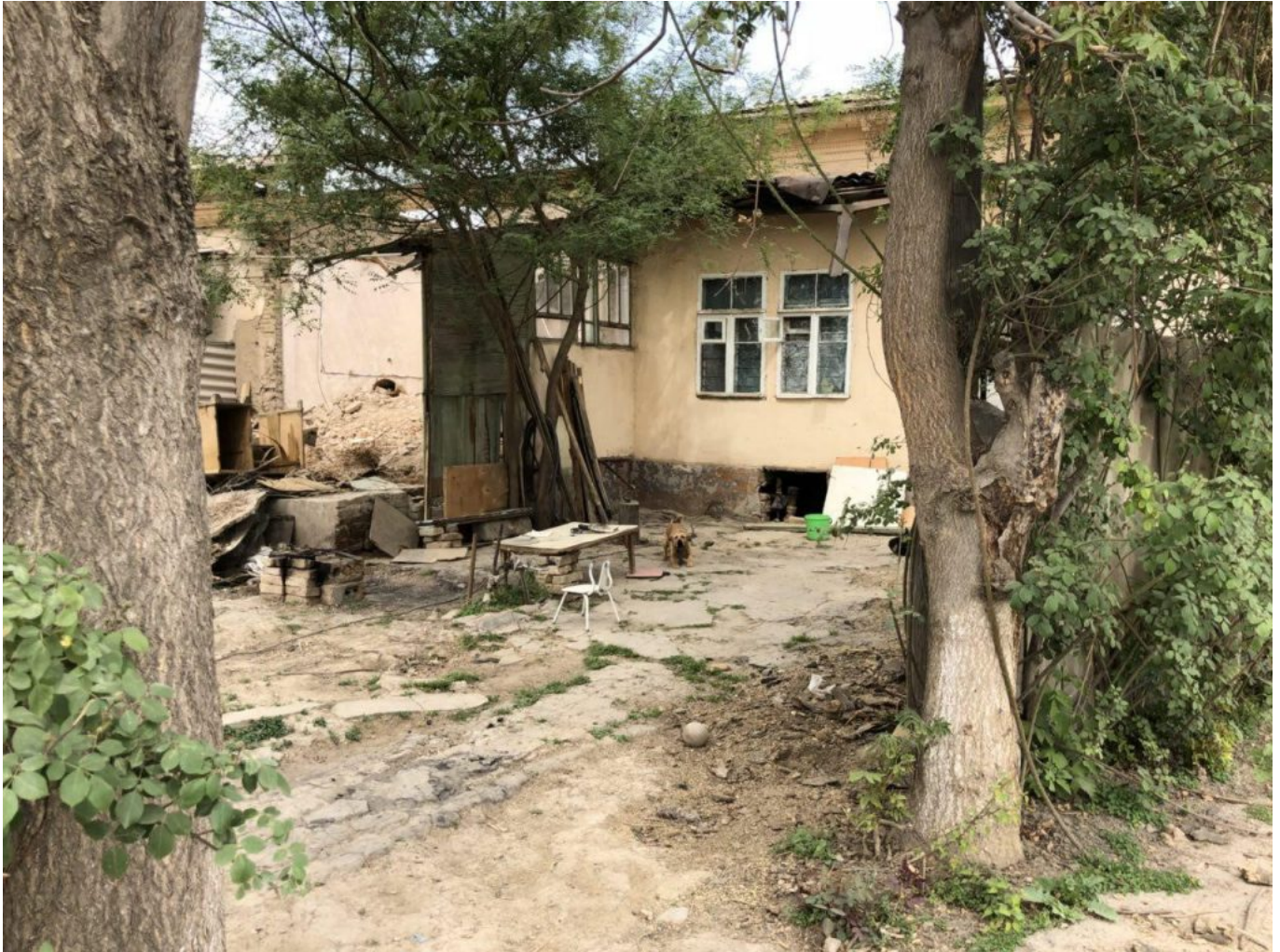
Традиционный дом в махалле Олмазор, предназначенный под снос (2018).

Как правило, в традиционных кварталах средний размер семьи больше, чем в семьях, проживающих в районах с многоэтажными жилыми домами. Семья, состоящая из отца, матери, двух-трех сыновей или дочерей (до их вступления в брак) и невесток, живет вместе в ховли ( традиционный дом ) с задним двором. Закон о собственности предусматривает полную защиту прав граждан на равнозначную замену собственности такого же размера и стоимости со своевременным уведомлением. В соответствии со статьей 4 Положения (2006 года) о «Порядке возмещения убытков гражданам и юридическим лицам в связи с изъятием земельных участков для государственных и общественных нужд» хокимият ( городская администрация ) соответствующих районов ( городов ) обязан уведомить собственников жилья в письменной форме. [vii] Кроме того, в дополнение к письменному уведомлению необходимо предоставить копии решений Совета министров и региональных городских советов или Общественного совета Ташкента об изъятии земельных участков и сносе жилых домов. Группа жителей