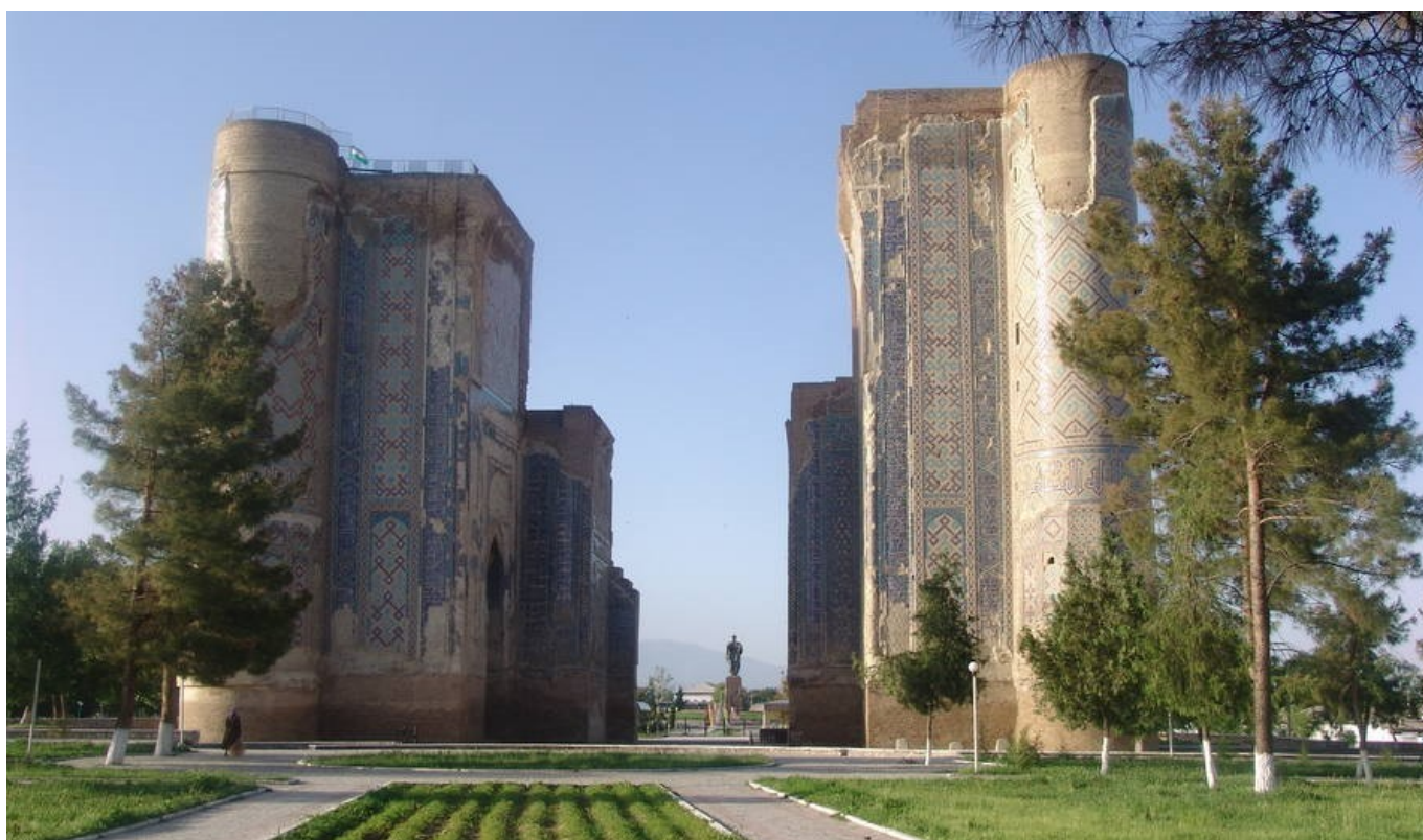
Исторический центр Шахрисабз в Самарканде находится под угрозой из-за ненадлежащей реставрации. Источник: ЮНЕСКО. Айнура Тентиева

опасность для исторически значимых мест представляет их «благоустройство» ради туризма. Примером является Самарканд, где в результате ненадлежащей реставрации и непрофессионального подхода некоторые объекты старого города были включены в 2008 году в список архитектурных объектов, которые нуждаются в усиленном мониторинге со стороны ЮНЕСКО. [xx]