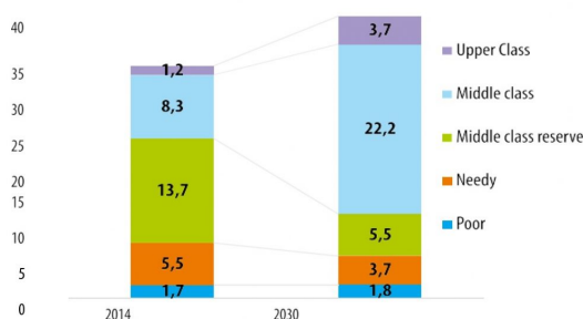
Рис. 1. Изменение социальной структуры населения, млн. человек.

Несмотря на то, что процесс городского планирования важно проверять, не менее важно понимать и оценивать степень возможности населения извлечь пользу из такого мега-проекта по городскому планированию как «Ташкент сити». Также правительство должно учитывать социальные слои населения при разработке крупномасштабных проектов планировки.