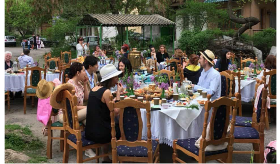
Жители Дома машинистов вместо митингов протеста проводили показ мод, фестивали и открытые рынки.

С другой стороны, культурные здания или памятники формируют то, как люди представляют себе историю и понимают национальную идентичность. Если не считать столицу, в региональных городах страны слабо признают ценность объектов исторического, архитектурного наследия и объекты культурного значения. Реальную