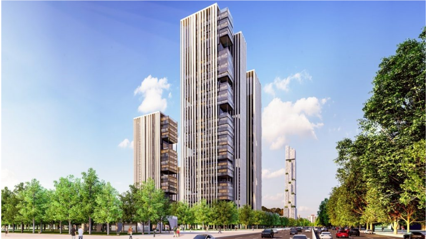
Модель «Ташкент сити».

Практика ребрендинга столиц со стороны лидеров для демонстрации своего влияния наблюдается во всех странах Центральной Азии. Бывший президент Казахстана Нурсултан Назарбаев создал бренд столицы Астаны, которая теперь названа в честь него Нур-Султан. В Туркменистане Туркменбаши ( первый президент Туркменистана ) приложил громадные усилия, чтобы увековечить свое имя в Ашхабаде с помощью масштабных строений, которые демонстрируют культ личности. Несмотря на то, что первый президент Узбекистана не показывал стремление к культу личности в физическом пространстве столицы, он обеспечил после себя наследие сильного лидера в ежовых рукавицах, который позже материализовался в форме памятников. Есть мнение о том, что нарративы о национальном бренд-имидже ( nation branding – перевод с англ. ) часто отражают выбор политических элит, о том, как они представляют себе бренд . В нем часто предлагается «прозападная» версия страны или города, подчеркивающая особенности, которые будут привлекать развитые страны с целью продвижения туризма, торговли и экономических инвестиций. [i] Сегодня нынешний президент Узбекистана Шавкат Мирзиёев активно настроен на создание нового имиджа столицы путем переориентации его как государства, отличающегося от прежнего авторитарного правления, которое существенно разрушило репутацию страны. Вскоре после вступления в должность, Мирзиёев инициировал амбициозный план по превращению центра столицы Ташкента в международный деловой центр с