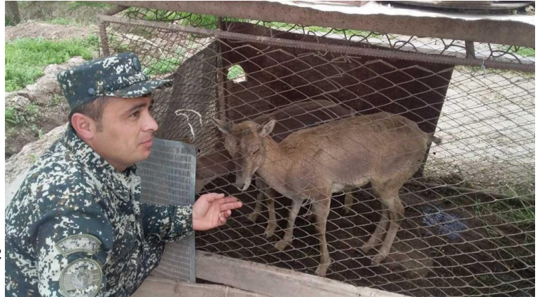
Спасенный специалистами Госкомэкологии джейран. CABAR.asia

В декабре 2019 года в Узбекистане вышло новое издание Красной Книги Узбекистана. В новое издание вошло 314 растений и 206 видов животных. Предыдущее издание содержало информацию о 324 видах растений — список дополнили 15 новых видов, 157 изменили свой статус, а количество «вероятно исчезнувших» изменилось с 19 до 10. Также в список попали 30 видов млекопитающих, 52 вида птиц и многие другие. На фоне этих радостных новостей, кажется, что краснокнижным животным страны ничего не угрожает, комитет экологии стоит на защите флоры и фауны.