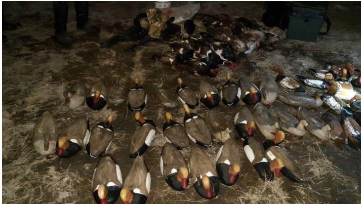
Двадцать пять уток, убитых за одну охоту в Муйнакском районе.

этой версии, в стране существовало свыше 10 документов, которые противоречили друг другу. Новый закон обозначил государственную политику в области охотничьего туризма, обозначен вопрос регулирования численности животных, и работы охотничьих хозяйств.