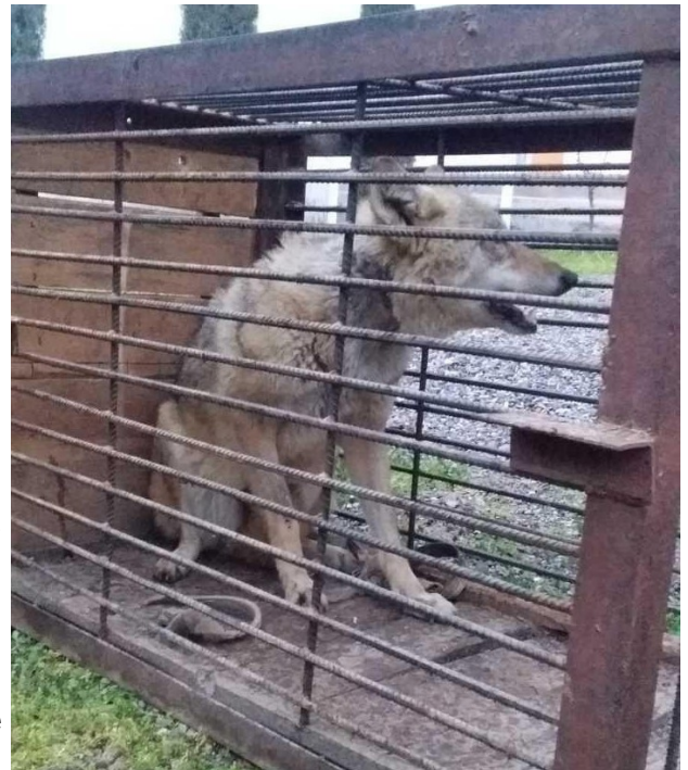
Департамент экологии Сурхандарьинского района конфисковали краснокнижного волка из частного дома. CABAR.asia

«Мне сложно что-то говорить о том, насколько лучше или хуже работают наши органы по охране животных. Есть конечно, какие-то подвижки, например, Каракалпакстанская Госкомэкология стала лучше работать, ее пресс-служба стала регулярно освещать работу своего ведомства в интернете. Большая проблема в том, что очень плохо работает контроль над исполнением, очень мало профессионалов по биоразнообразию в системе Госкомэкологии. Оснащение природоохранной инспекции оставляет желать лучшего, да и повторюсь — основная проблема в отсутствии в стране специалистов», – сказала