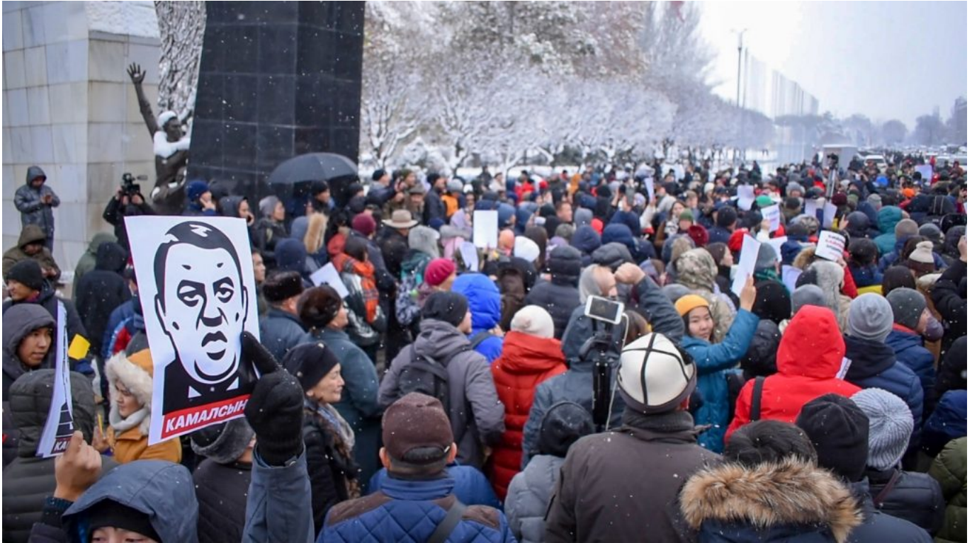
На ноябрьском митинге против коррупции в Бишкеке. Толчком к организации митинга послужило журналистское расследование Клоор, «Азаттыка» и OCCRP.

Более того, ряд политиков в ответ выступили с публичной поддержкой Матраимова. Еще более шокирующей оказалась неожиданная информационная атака на сам Радио «Азаттык», которая была продолжена, что также оказалось неожиданным, известными и даже авторитетными журналистами. А перед этим те же коллеги выпустили свое контр-расследование, формально объясненное ими заботой о «чистоте жанра», но которое оказалось больше похожим на бомбу против «Азаттыка».