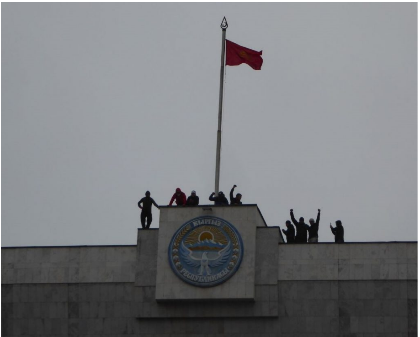
Штурм Белого дома в Бишкеке митингующими утром 6 октября.