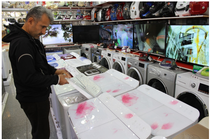
Стиральные машины Artel из Узбекистана в одном из магазинов бытовой техники в Душанбе.