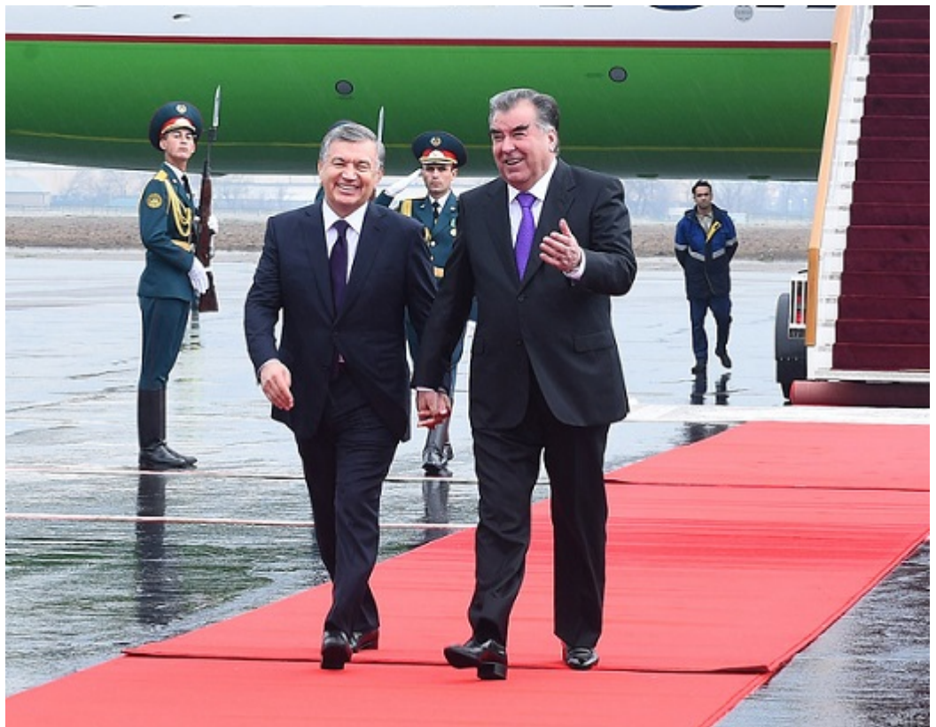
У президента Таджикистана есть привычка брать за руки своих собеседников.

После вступления в должность новый президент Узбекистана Шавкат Мирзиёев заявил о приоритетности восстановления и улучшения отношений с соседями, и до этого на уровне глав приграничных территорий и министерств начал активизировать