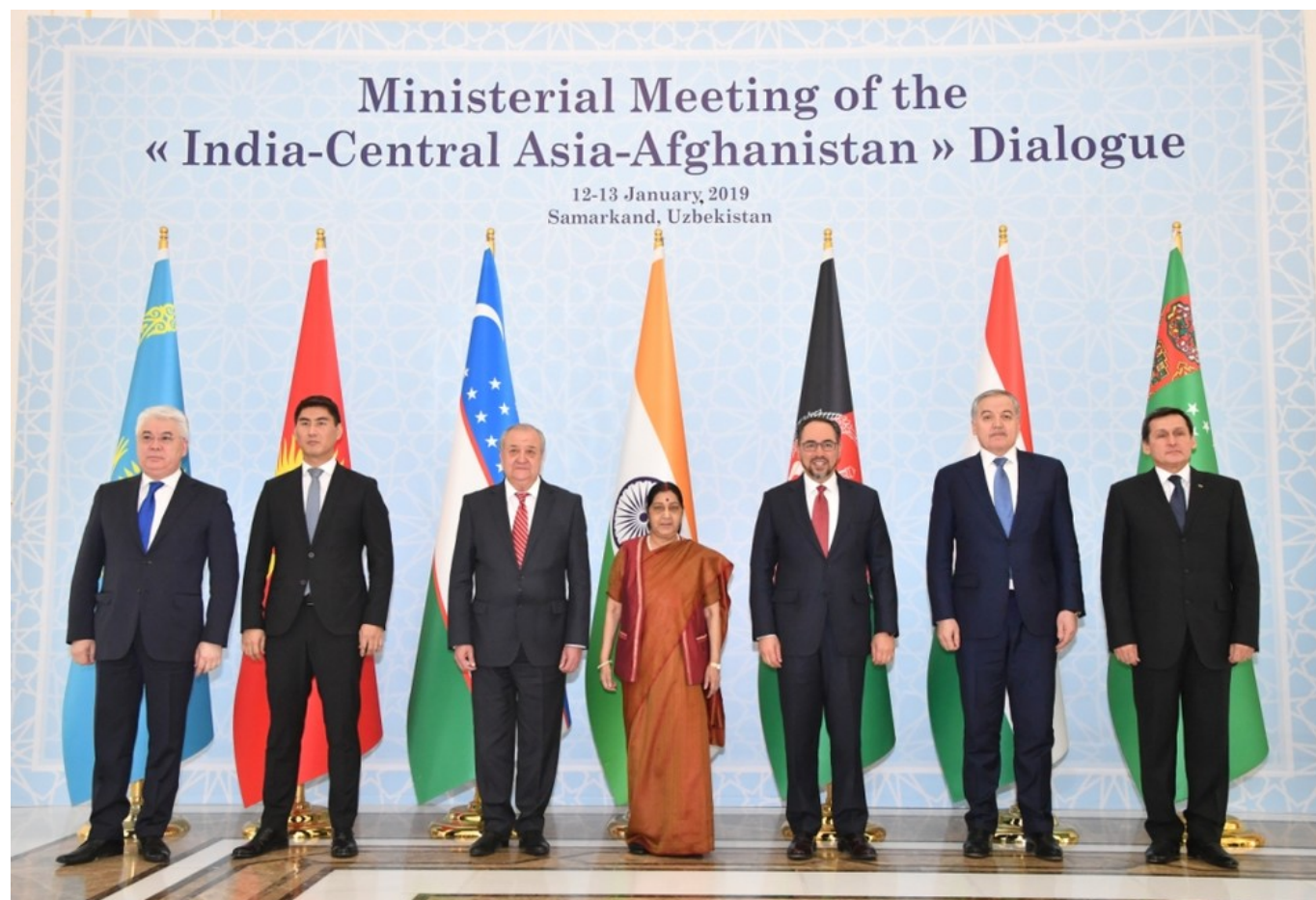
Первая встреча министров иностранных дел семи государств в рамках Диалога «Индия – Центральная Азия» в 2019 году в

Геополитика во многом определяет позиции Индии в регионе. Перманентное противостояние с Пакистаном крайне негативно сказывается на связях Дели с центральноазиатскими республиками. Пакистан отказывает Индии в транзите через свою территорию, что ограничивает возможности сотрудничества с Афганистаном и Центральной Азией.