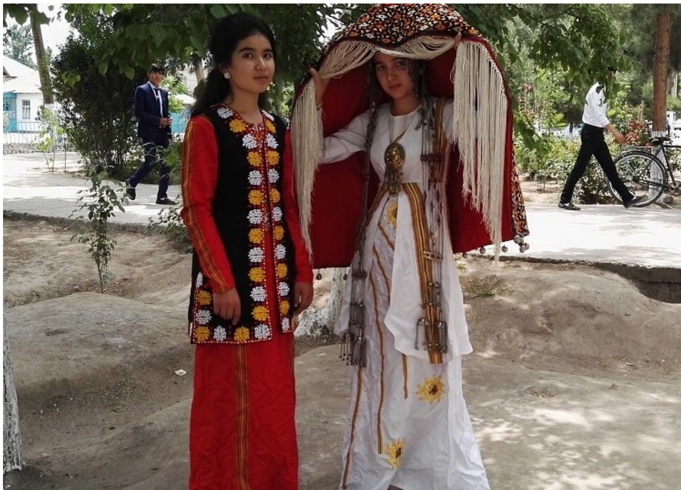
Туркменские девушки.

Такая свобода удивительна для их соседей таджиков, где женщины менее свободны и зависят от своих мужчин. Поэтому иногда здесь можно слышать вопросы, мусульмане ли они, и какую религию исповедуют?