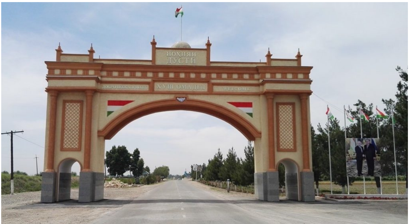
Район Дусти.

Туркменов можно сразу отличить от их таджикских соседей. В дни религиозных или официальных праздников туркменские мужчины обязательно надевают национальные шапки, а женщины - традиционные длинные платья с туркменским орнаментом.