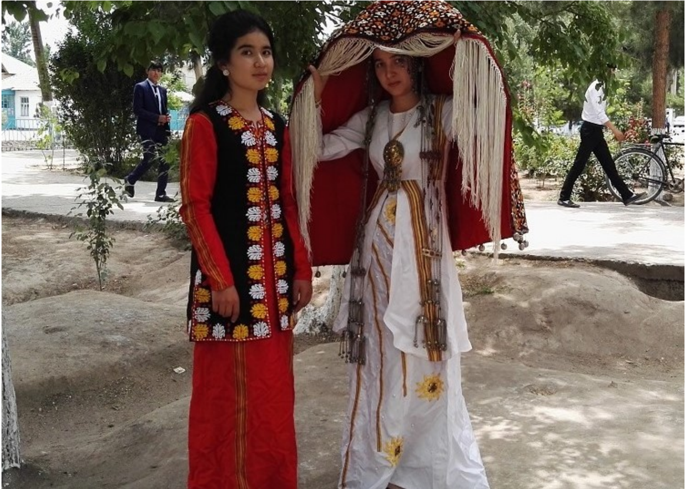
Туркменские девушки.

Такая свобода удивительна для их соседей таджиков, где женщины менее свободны и зависят от своих мужчин. Поэтому иногда здесь можно слышать вопросы, мусульмане ли они, и какую религию исповедуют?