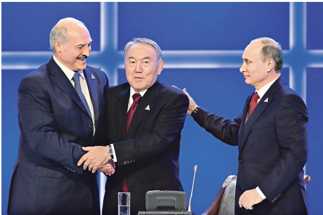
29 мая 2014 года в Астане президенты России, Белоруссии и Казахстана подписали договор о Евразийском экономическом союзе (ЕАЭС).

Подпишитесь на нашу страницу в Facebook!