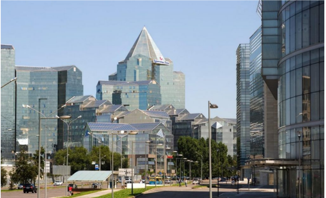
«Обычно анализ Doing Business основывается на результатах лишь одного крупного города страны. В случае Казахстана это Алматы».

Важно отметить также безоговорочную «капитуляцию» малого и среднего бизнеса перед монополистами и крупнейшими компаниями в республике, деятельность которых во многих случаях координируется влиятельным политическим истеблишментом страны. Это предоставляет им, во-первых, безграничный доступ к финансовым ресурсам, во-вторых, манипулировать ценами на рынке. Следовательно, установившаяся недобросовестная конкуренция на местном рынке связывает руки предпринимателям меньшего размера и заставляет их покидать «поле боя».