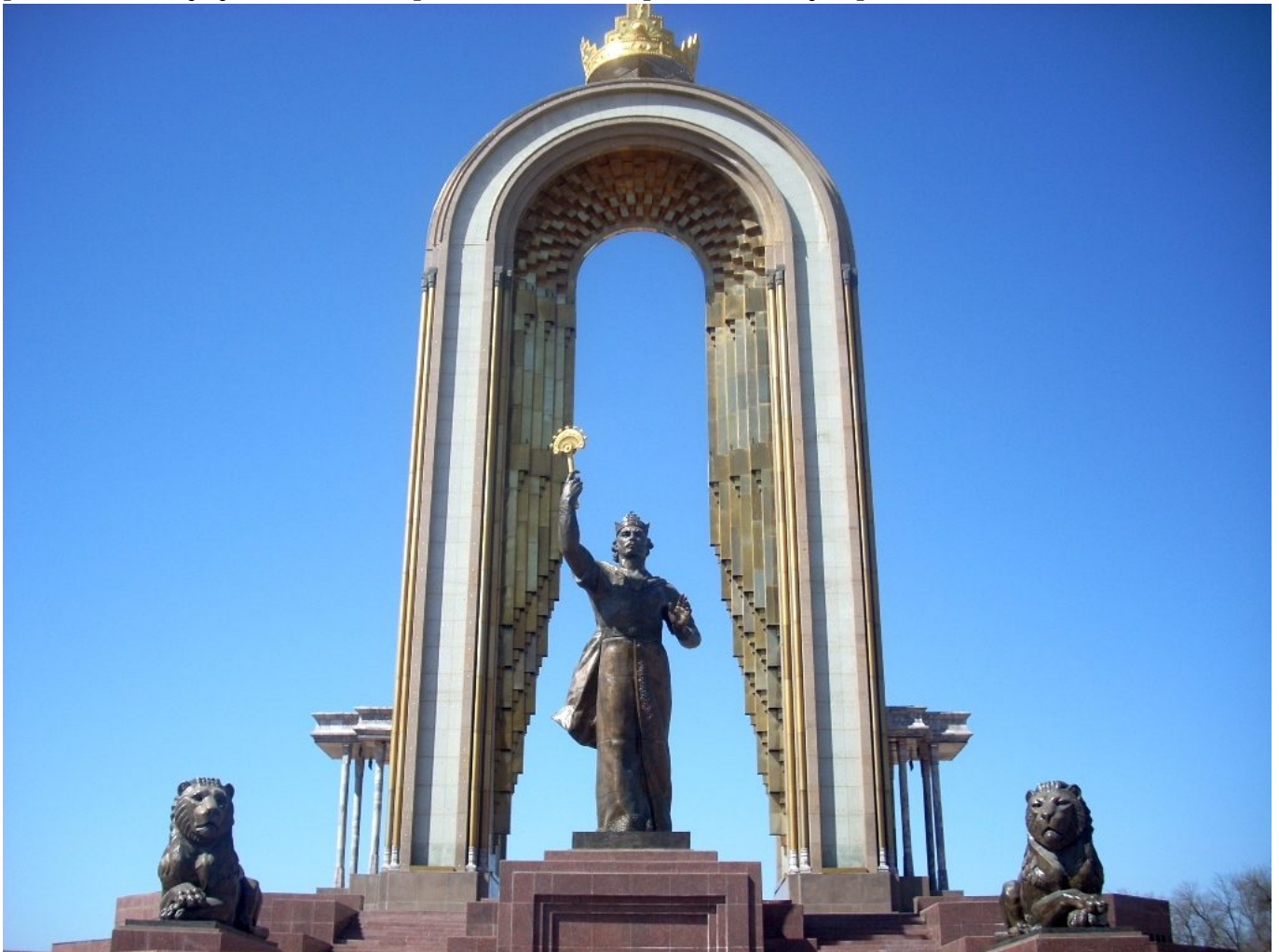
Поддержка "традиционного" ислама дает возможность использовать его как связующие звено при конструировании и укреплении национальной идентичности. Памятник Исмаилу Сомони в Душанбе.

помпой проводится международный симпозиум «Наследие имама Абу Ханифы и его роль в межцивилизационном диалоге», официально запрещены различные течения, в новой редакции Закона Республики Таджикистан «О свободе совести и религиозных объединениях» принимается такая часть, как «признавая особую роль ханафитского направления исламской религии в развитии национальной культуры и духовной жизни народа Таджикистана» [5] , то есть ханафитский мазхаб чуть ли не объявлен официальным религиозным течением государства. Все произошло по классическому сценарию: «принадлежность к тому или иному мазхабу в некоторых условиях прямо означало поддерживать то или иное правительство, поскольку различные мусульманские правительства играли большую роль в смене мазхабов». [6]