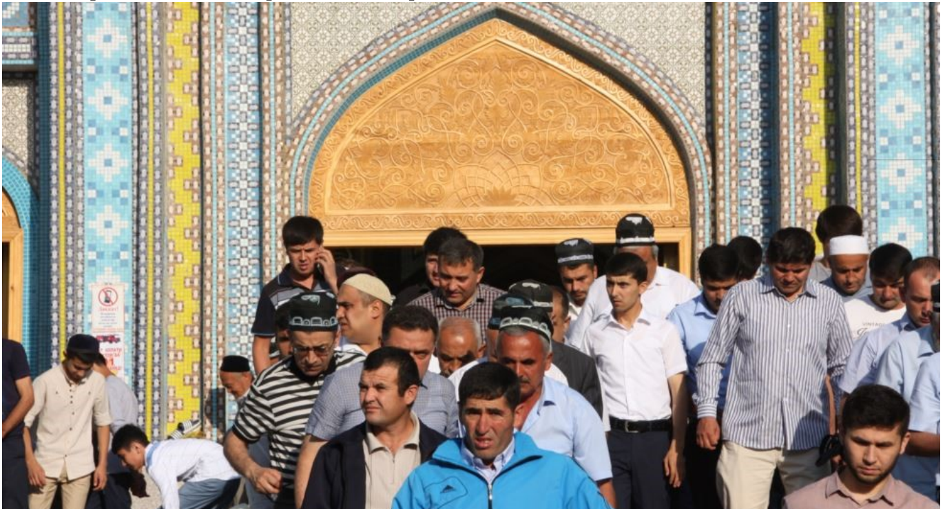
В 1990-е появилась новая волна духовенства из числа молодежи получившей образование за границей.

Глобализационные процессы, наряду с неоспоримыми достижениями и преимуществами, также несут ряд вызов и угроз для традиционных обществ, и национальных государств. Данные вызовы особо чувствительны для молодых государств, находящихся на начальной стадии становления независимого государства и построения национальной идентичности. Религия, в частности ислам, стала частью общих глобализационных процессов со всеми вытекающими последствиями. Религиозный фактор стал играть важную роль в конце 80-х годов прошлого века. Это связано с ослаблением контроля советского государства над религией и усилением центробежных и националистических тенденций в национальных республиках. В данных странах усилился интерес к элементам идентичности как язык и религия, что в определенной степени сыграло немаловажную роль в первых межэтнических и межконфессиональных трениях и конфликтах.