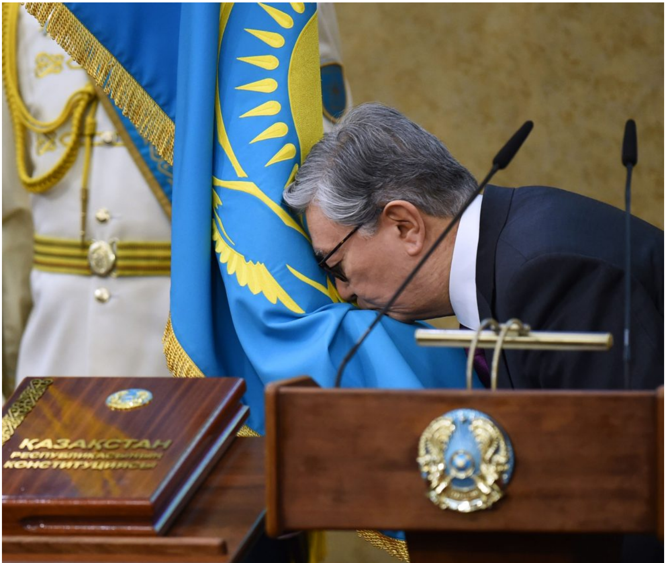
Церемония принесения присяги народу Казахстана Президентом Республики Казахстан.

будущую кандидатуру. То есть речь не идет о том, что уже был определенный преемник в течение последних десяти лет. Их было несколько человек, из которых все-таки экс-президент выбирал, и Токаев был одним из них. Поэтому я думаю, что вполне возможно, что уже тогда экс-президент расставлял будущих кандидатов и давал им возможность получить тот опыт, который необходим для занятия будущей должности, где они могли показать себя и получить узнаваемость для международного сообщества.