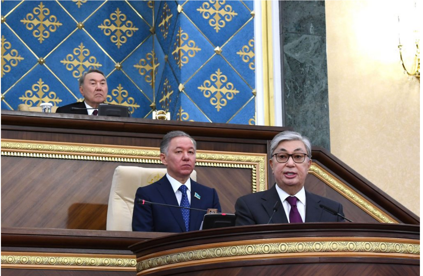
У Назарбаева было время оценить качества Токаева, в том числе надежность.

В то же время я хотел бы подчеркнуть, что Токаев не является заведомо слабой кандидатурой и политиком. Речь идет о новом президенте, которому присущ совершенно другой политический стиль. Токаев большую часть жизни проработал в системе министерства иностранных дел, руководил этим ведомством, работал в парламенте. Поэтому для него больше свойственен поиск компромиссов, у него не мягкий, но и не конфликтный стиль. При этом он является опытным управленцем иначе бы экс-президент Назарбаев за предыдущие годы не поручал бы ему такие ответственные направления. Причем самые важные, быть вторым лицом в государстве. Мы все помним, что бывало немало моментов в политической практике Казахстана, когда ситуация требовала реагирования со стороны официальной власти, но при этом выступал не президент, а часто от имени власти, в щекотливых ситуациях, мнение выражал именно Касым-Жомарт Токаев.