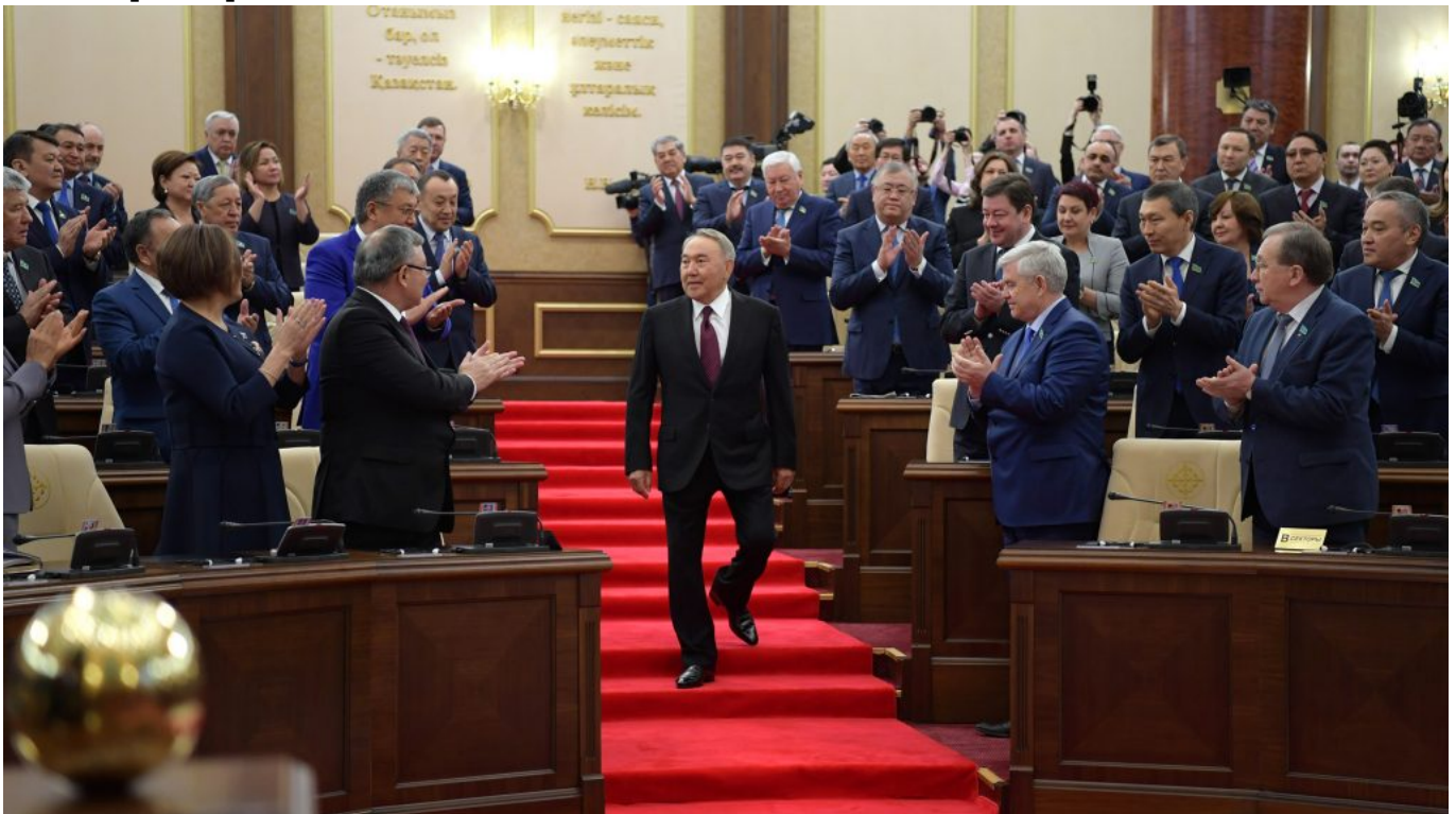
Для Назарбаева важно, чтобы Токаев оставался приверженным к его политическому наследию.

Нынешняя система безусловно выстроена под Назарбаева, но фактически дано время для переходного периода, для транзита, в течение которого политическая система может адаптироваться под новых лиц. Сам факт того, что модератором этого транзита выбран Токаев тоже говорит о многом. Он будет осуществлять линию политической элиты, но в то же время он достаточно гибок, чтобы вносить необходимые изменения. И потом я думаю, что перед самим Назарбаевым сейчас не стоит задача сохранить именно назарбаевский Казахстан именно в этом виде. Во-первых, на самом деле Назарбаев сам прекрасно понимает, что он уже достиг определенных лет и для него наверное более важно, чтобы Токаев оставался приверженным к его политическому наследию. Второе, это важно для ближайшего окружения первого президента, чтобы были гарантированы их безопасность и положение в новом Казахстане.