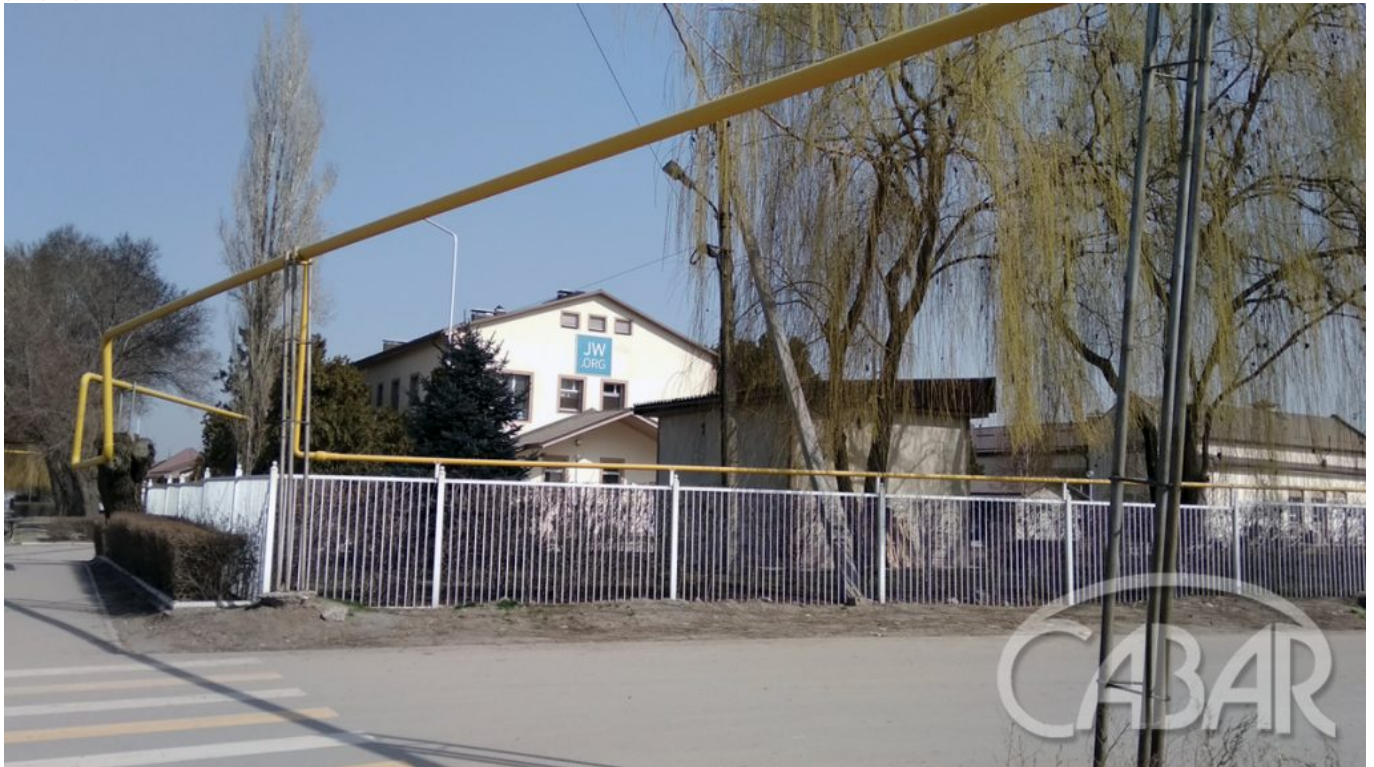
«Иегова күбөлөрүнүн» Бишкектеги филиалы.

Советтер Союзу кулагандан кийин, 1993-жылы расмий юридикалык статуска ээ болдук. Ал эми 2004-жылдан тартып, филиалыбыз иштеп келет. 1974-жылы алгачкы кыргыз улутундагы жаран Жахабанын күбөсү болгондугу кызык.