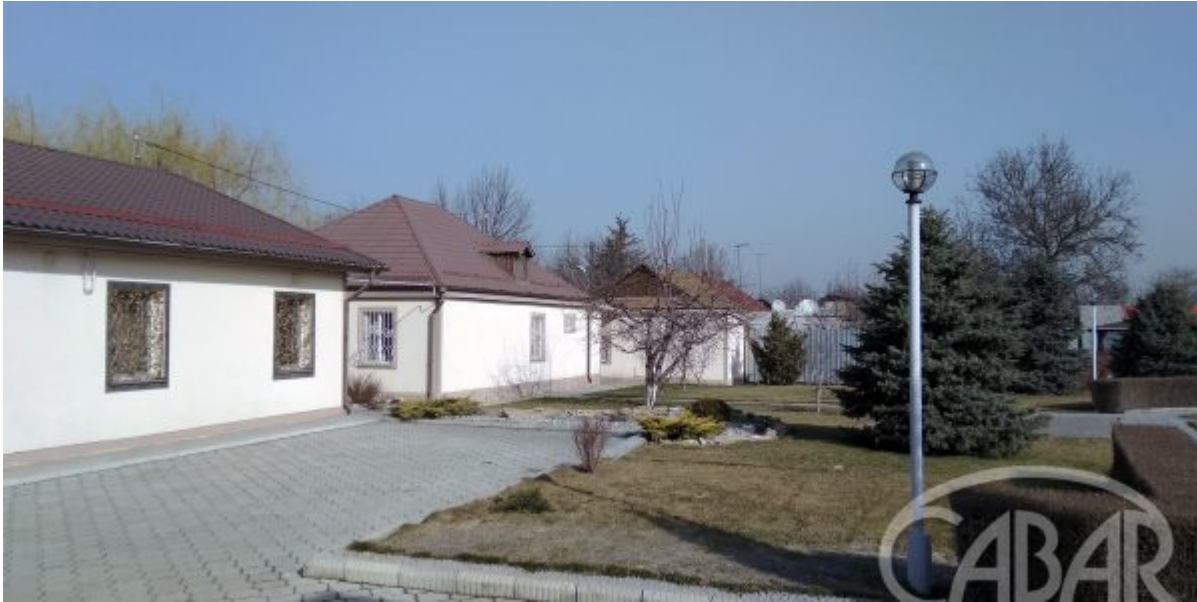
«Жахабанын күбөлөрүнүн» Бишкек шаарындагы филиалынын аянты 1,5 га түзөт. Бул жерде административдик имараттар, спорт аянтчасы, ошондой эле филиалда кызмат өтөгөн бейтелдиктер үчүн турак-жайлар жайгашкан. Булардын баары акысыз берилет.

Мындан тышкары, биз бийликке баш иебиз, бирок шайлоого катышпайбыз. Себеби, Кудайдын падышалыгы менен анын башкаруусу жөнүндө кабар таратабыз. Кудай өзүнүн уулу Иса Машаякты (Иса Пайгамбар) падыша кылып дайындаган. Башкача айтканда, биздин падышабыз, өкүмдарыбыз бар, ал эми учурдагы бийлик убактылуу ордун гана ээлеп турат. Болбосо, башаламандык келип чыкмак.