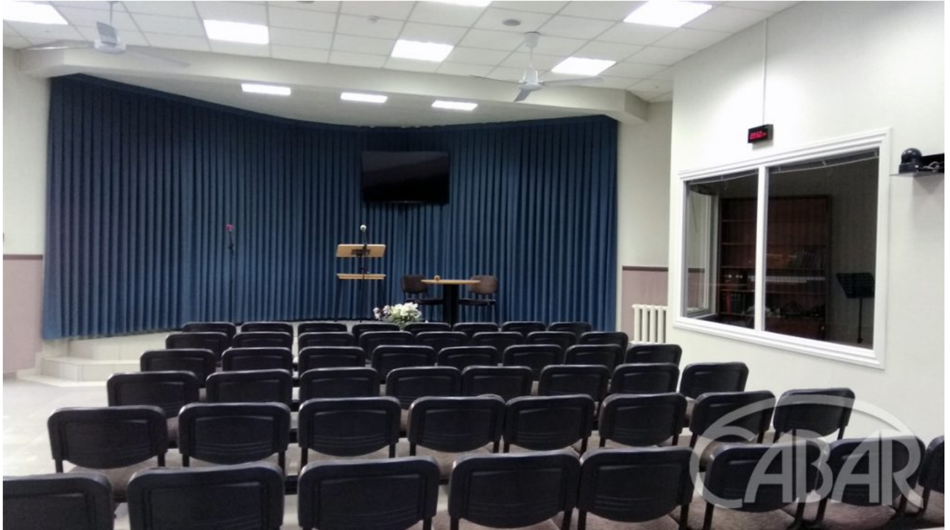
Жахабанын күбөлөрүнүн жыйындары өтө турган зал.