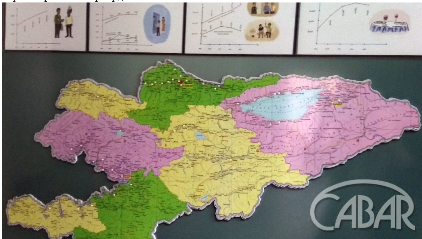
Картада Кыргызстандын Жахабанын күбөлөрүнүн жолун жолдоочулары жашаган калктуу жерлери көрсөтүлгөн.

Прозелитизмге тыюу салуу - абдан татаал түшүнүк. Башкаларга диний ишеними тууралуу айтып бербесе, эл менен байланыш түзүүгө мүмкүн болбойт да. Эң негизги ишмердүүлүгүбүз - элге Кудай, Кудайдын падышалыгы тууралуу айтып берүү. Ошентсе да, биз мыйзамга баш ийген жарандарбыз. Үйлөрдү кыдырып же коомдук жайларда адабияттарды таратпайбыз, биз тек гана диний ишенимибиз тууралуу бөлүшөбүз. Ал эми кимде ким китептерди алгысы келсе, бизге келип, атайын караштырылган жерлерден алып кетишет.